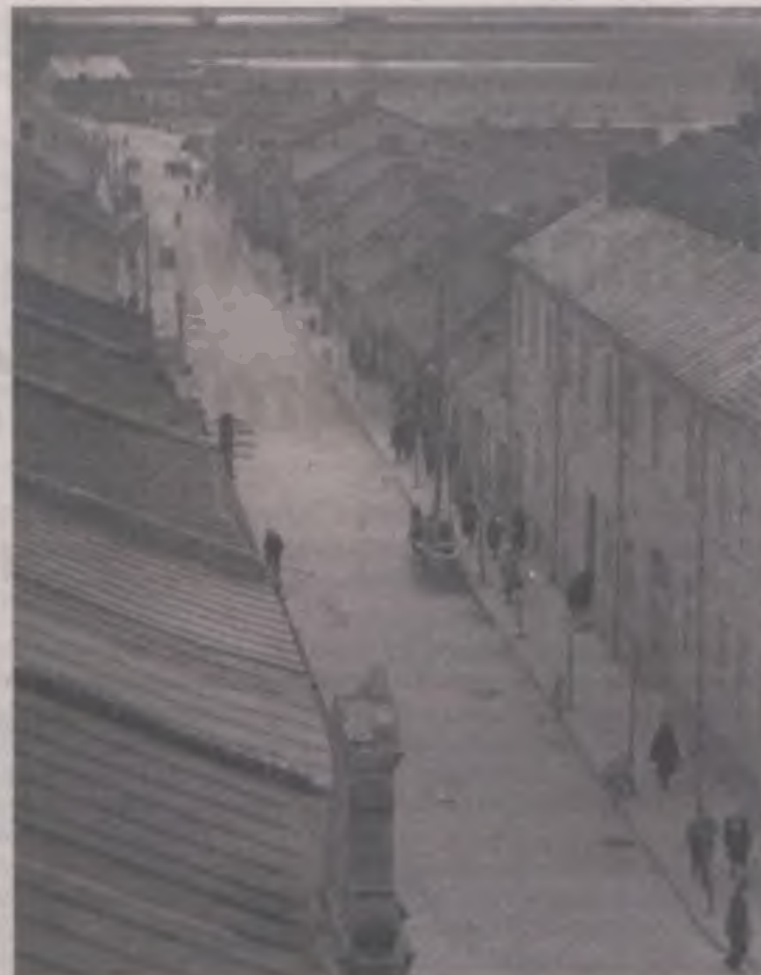
Przez znakomitą część swojej historii Kolska była mieszkalną dzielnicą Turku.

terenie miasta od ulicy Mickiewicza do końca Kolskiej i od Dobrowskiej do skrzyżowania 3 Maja i Żeromskiego zameldowanych było raptem nieco ponad 900 osób. Tymczasem wedle przywoływanego już Kruszyńskiego tylko na nieco większym obszarze w Turku w roku 1890 mieszkało 7563 dusz. Inaczej mówiąc, w ciągu stulecia śródmieście miasta przestało pełnić funkcję mieszkalną. Została ona zredukowana przez funkcję handlowo-usługową. Ale rzeczywistość cały czas ulega zmianie, a młyny historii cały czas mieli. I w rezultacie zachodzących procesów ekonomicznych i cywilizacyjnych zauważalne staje się