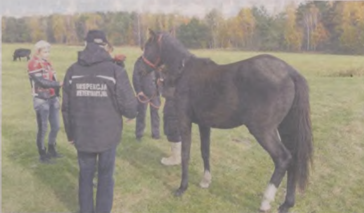
Chwilę przed kontrolą, mieszkaniec Miłkowic wyprowadził zwierzęta na pole za lasem. By je obejrzeć, Straż Zwierząt, Fundacja z Warszawy i lekarz weterynarii, musieli tam dojść.