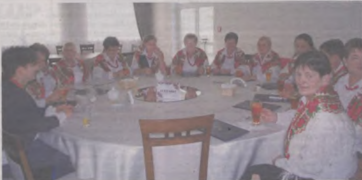
Zasiedli przy okrągłych stołach.

Jarzębinki z Malanowa zaśpiewały biesiadne piosenki „Bando, bando” i „Życie jest piękne” oraz religijną „Kochana Matko”. Turkowianki zaprezentowały się w repertuarze okresu międzywojnia. Wysłucha-