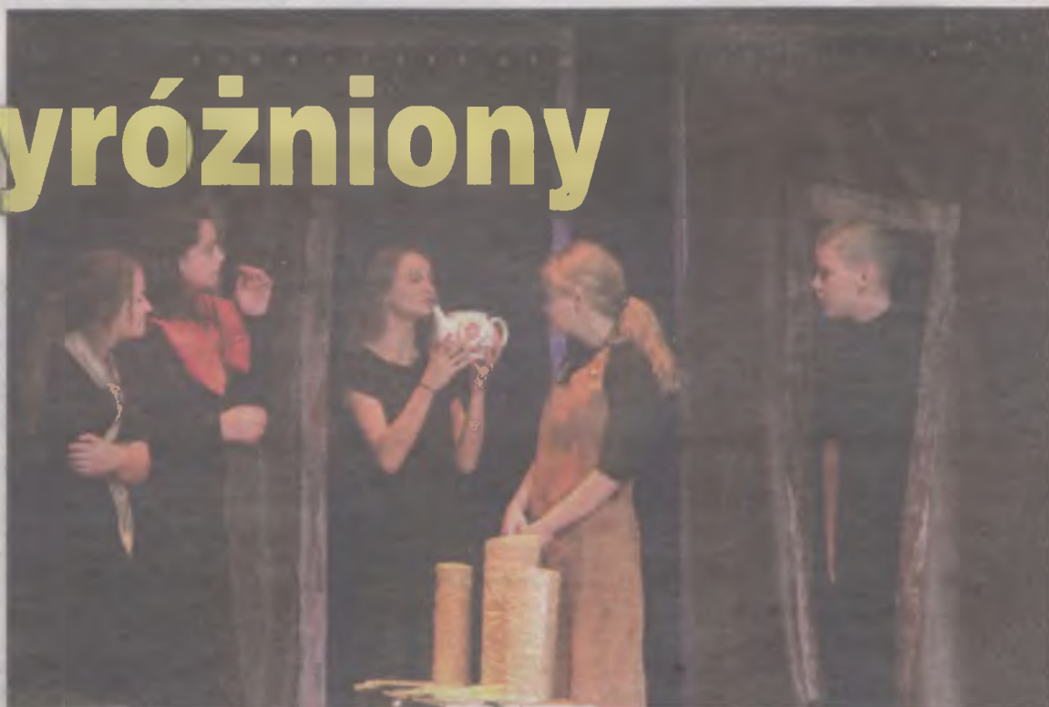
Grupa teatralna z Przykona zaprezentowała „Baśń o grającym imbryku”.