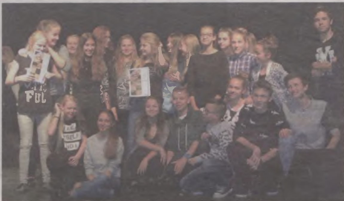
„Debiut” otrzymał wyróżnienie.