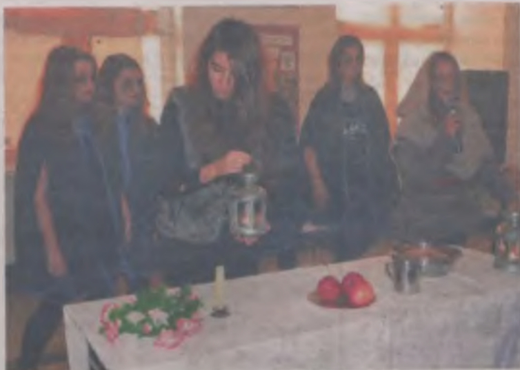
Inszenizacja „Dziadów” w Gimnazjum nr 2 w Turku.