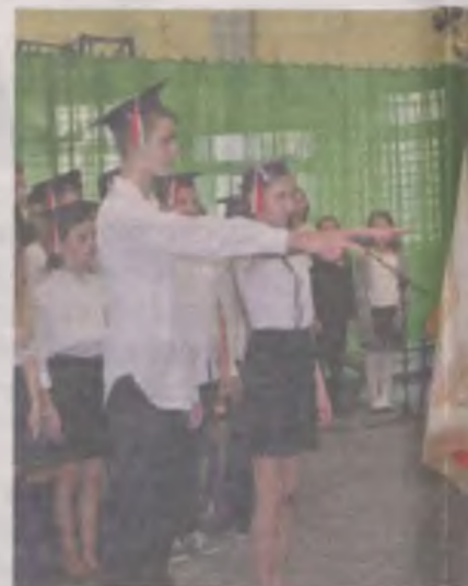
Ślubowanie pierwszoklasistów złożył na-