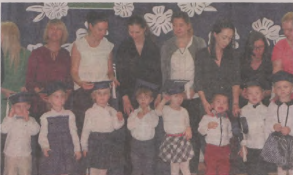
Nowi przedszkolacy i dumne z nich mamy.