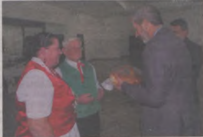
Serenada urządziła w Malanowie dożynki.

Nastrojowo i teatralnie w Gimnazjum nr 2