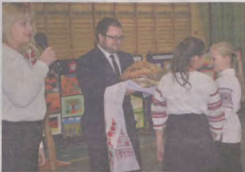
Prezent jaki przywieźli ukraińscy goście - okazały „korowaj” podzielony został wśród uczestników uroczystości.

Pasowanie na gimnazjalistę poprzedzone zostało ślubowaniem na sztandar szkoły, w którym pierwszoklasiści obiecali między innymi ak-