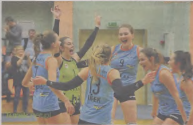
Tak cieszyły się zawodniczki „Alexas” Turek z wygranego meczu.