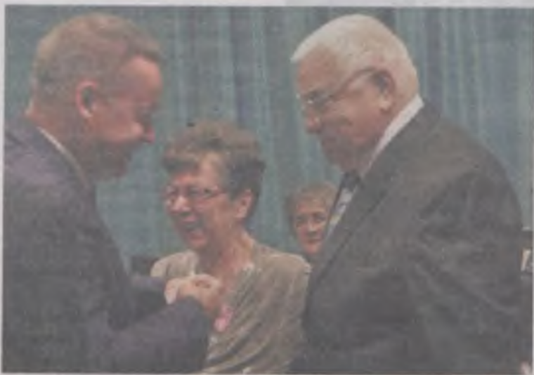
Wyśmienity humor dopisywał wszystkim obecnym na sali.

Po części oficjalnej Jubilatów zaproszeni na poczęstunek i chwilę