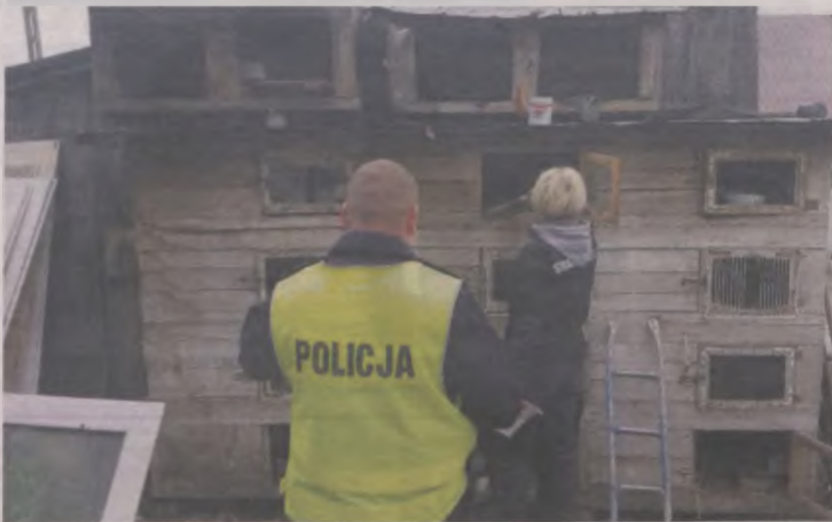
Małą przerażoną suczkę strażniczki zwierząt znalazły w klatce na króliki.

razy przybiegł zbyt blisko posesji młodego rolnika, który brutalnie złapał go w sidła, wywlekl na pole i zaczął okładać kółkiem. Podobno w ten sposób człowiek chciał „ukarać” zwierzę za to, że zagryzał mu kury i indyki. W obronie psa stanęła sąsiadka, krzycząc, by go zostawił. Na szczęście mężczyzna opanował się i puścił zwierzę. Wtedy ludzie złapali ranne zwierzę i powiadomili córkę jego właściciela. Dziwnym trafem, bo według burmistrza wcześniej losem psa się nie interesowała, teraz bez chwili wahania poprosiła Straż Zwierząt o przewiezienie psa do jej domu.