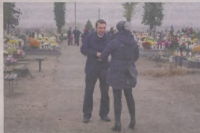
Odwiedzający cmentarz nie żalowali grosza.

Na szczęście wątpiących w słuszność tej akcji było niewielu. W sumie do puszek i skarbonek trafiło 3767,81