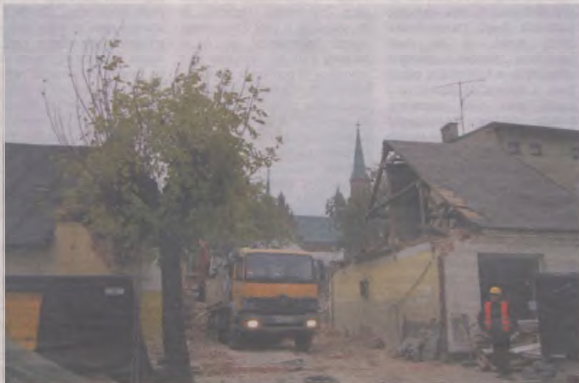
Nowemu właścicielowi obiektu przy ul. Kolskiej 6 i 8 pozostało jedynie wynająć ekipę rozbiorczą i w przysłowiowe trzy kroki od rynku pojawiła się działka budowlana.

Oplakany stan techniczny wszystkich stojących tam zabudowań nie był żadną niespodzianką, toteż inwestorowi nie pozostało nic innego niż przystąpić do gruntownej ich rozbioru. Tylko pod fragmentem zabudowań były piwniczki, a pozostałe budowle stały na kamieniach. Stąd już w październiku br. o przyszłowiowe trzy kroki od turkowskiego ryneczku mamy dzisiaj pusty plac o łącznej powierzchni niemal 15 arów.