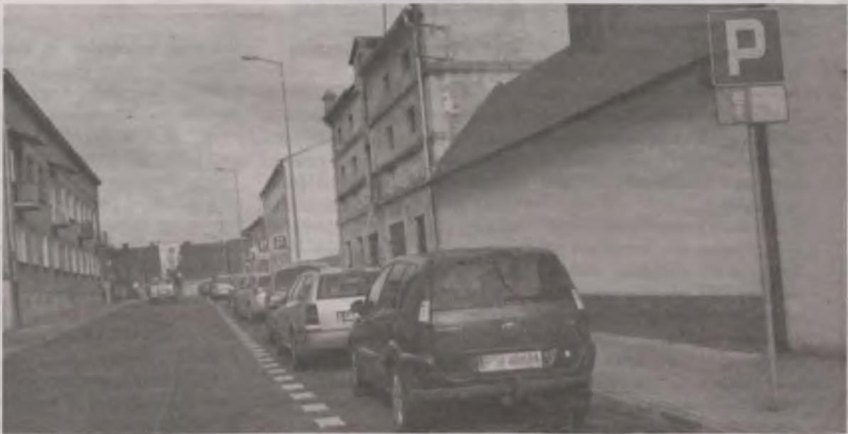
Przez kilka lat na poziomym parkingu przy ulicy Szkolnej, kierowcy stawiali auta ukośnie. Nikomu to nie przeszkadzało do czasu, gdy powstała policyjna Mapa Zagrożeń Bezpieczeństwa. Wtedy mieszkańcy zaznaczyli na niej przewinienia turkowie.

W zaistniałej sytuacji turkowie domagają się zmiany prostopadłych miejsc na ukośne. Okazuje się jednak, że nie ma takiej możliwości, bo zgodnie z obowiązującymi przepisami jezd-