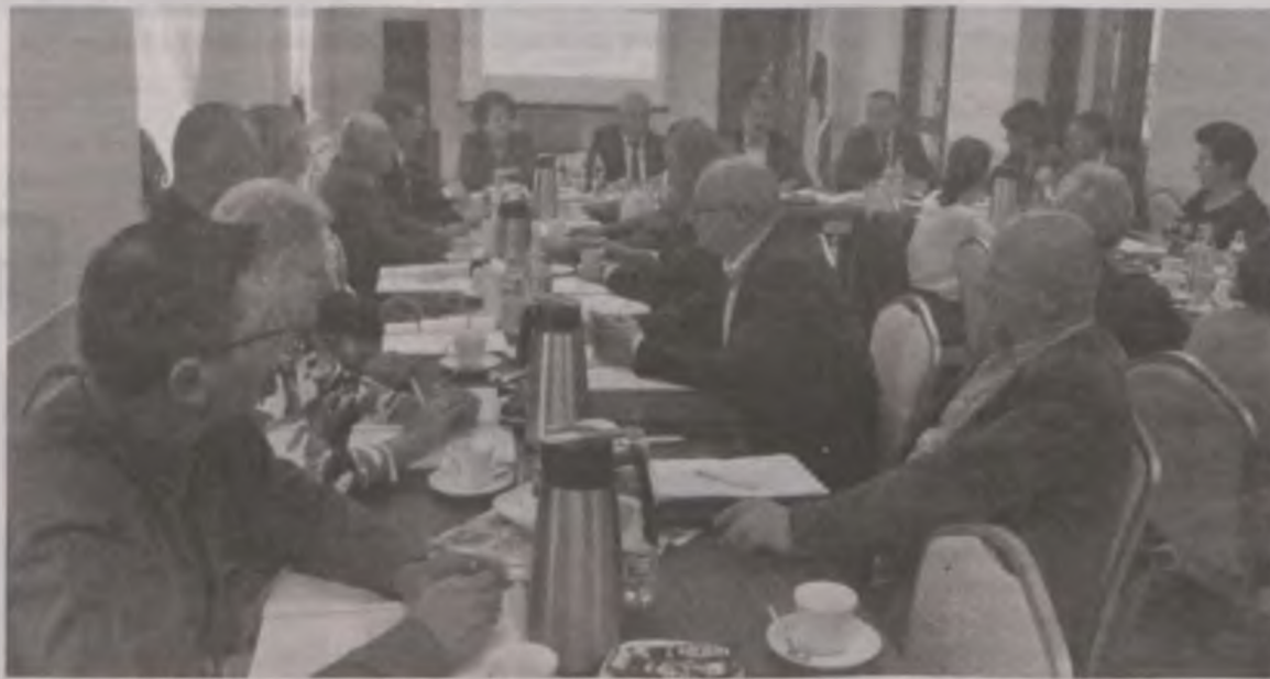
Tym razem sesja odbyła się w gościnnych progach domu kultury w Kolnicy.

Z kolei stawka podatku od budynków wyniesie: a/ mieszkalnych - 0,61 zł/m kw.; b/ budynków związanych z prowadzeniem działalności gospodarczej - 22,50 zł/m kw.; c/ związanych z udzielaniem świadczeń zdrowotnych - 4,61 zł/m kw.; c/ zajętych na prowadzenie działalności gospodarczej w zakresie obrotu kwalifikowanym materiałem siewnym - 10,59 zł/m kw.; pozostałych, w tym zajętych na prowadzenie odpłatnej statutowej działalności przez organizację poży-