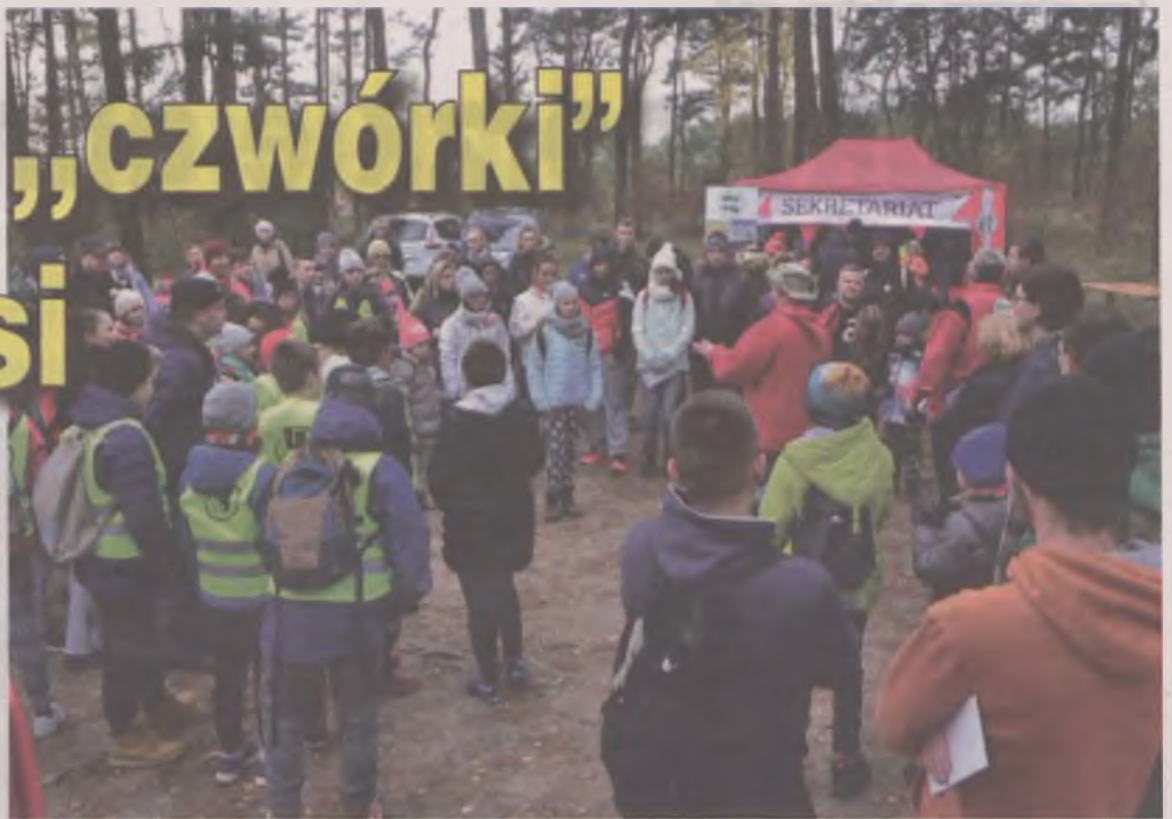
W niedzielnej imprezie na orientację wzięło udział ponad 150 osób.

pada miłośnicy pieszych wędrówek zebrali się na parkingu leśnym przy Zdrojkach Lewych. Jak tłumaczyli organizatorzy, impreza polegała na znalezieniu jak największej ilości