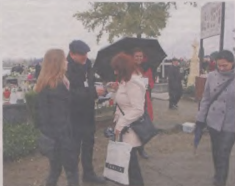
Wręczano ulotki i zbierano datki.

wiedząc cmentarz każdego dnia nie omieszkiwali dołożyć do puli zebranych pieniędzy choćby symboliczną złotówkę.