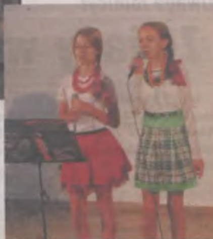
Folkowe gimnazjalistki w piosence „W zielonym gaju”.

Wójt z przewodniczącym malanowskiej rady gminy pogratulowali zespołom i wręczyli pisemne podziękowania. Kwiaty i list gratulacyjny