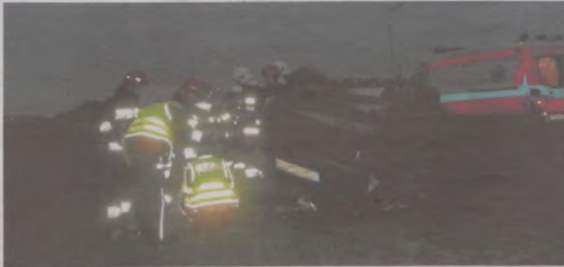
Zarówno sprawcą, jaki i poszkodowanym w wypadku był 35-letni kierowca forda focusa.

chował w rowie. Rannego mężczyznę z samochodu wyciągnął policjant i przekazał strażakom ochotnikom z Władysławowa, wśród których byli ratownicy przedmedyczni. Ci opatrzyli mu rany, podali tlen, a następnie położyli na deskę ortopedyczną i przekazali ekipie pogotowia ratunkowego, która przewiozła mężczyznę do szpitala w Koninie.