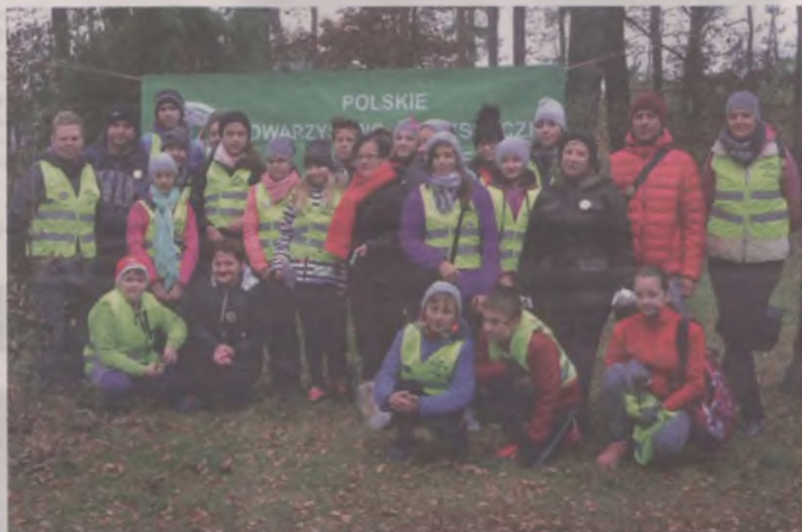
Już drugi raz z rzędu trasę szkolną imprezy najlepiej pokonali uczniowie z turkowskiej Szkoły Podstawowej nr 4.

punktów oznaczonych na mapie biało-czerwonymi lampionami. By mieć pewność, że wszyscy znają zasady panujące podczas imprezy, pokazano jak będą wyglądały punkty oznaczone lampionami.