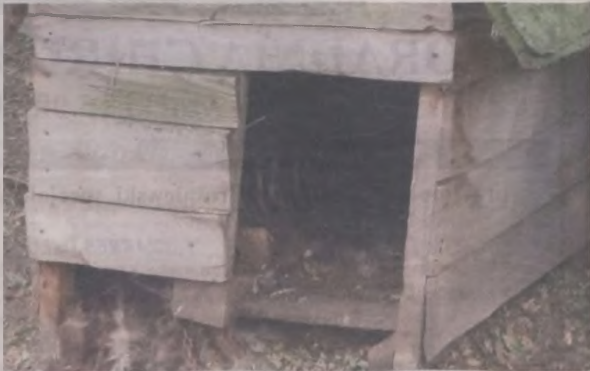
Na końcu podwórka, tak żeby nikt jej nie zobaczył, stała rozwalająca się buda. A w niej rozkładające się zwłoki psa, który najprawdopodobniej konał w okropnych męczarniach. Tak jak żył, tak odszedł z zaciśniętym łańcuchem na szyi.

Mężczyzna trzyma też na posesji krowy i konie, dlatego na następną