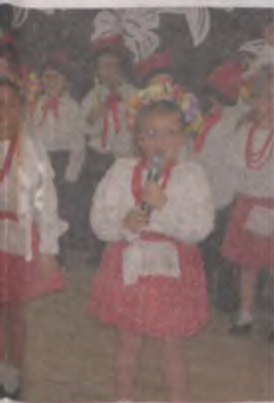
zaprezentowały się „starszaki”.