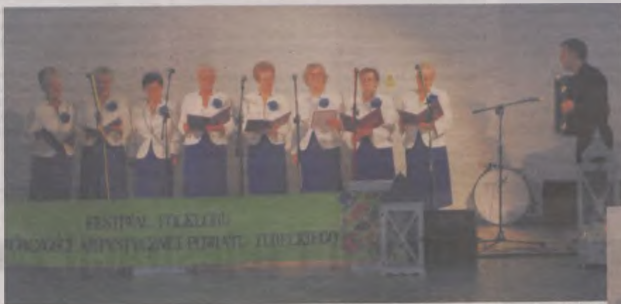
Turkowianki w międzywojennych szlagierach.

werwy skrzypkami. Było widać i słyhać, że granie i śpiewanie sprawia im radość i przyjemność. W ich wykonaniu usłyszano „Zaśpiewaj słowiku”, „Trzy razy kukuleczka” i „Wysoki zamek”.