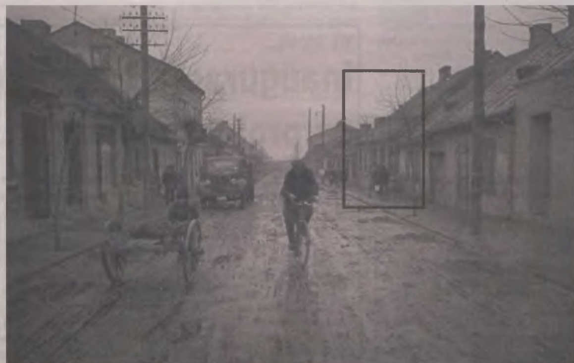
Ulica Kolska mimo że była jedną z 19 najstarszych ulic Turku, to dopiero w latach 80 XX wieku przypadła jej rola głównego traktu handlowego miasta. Na zdjęciu zaznaczono prostokątem rozebrane kamienice.