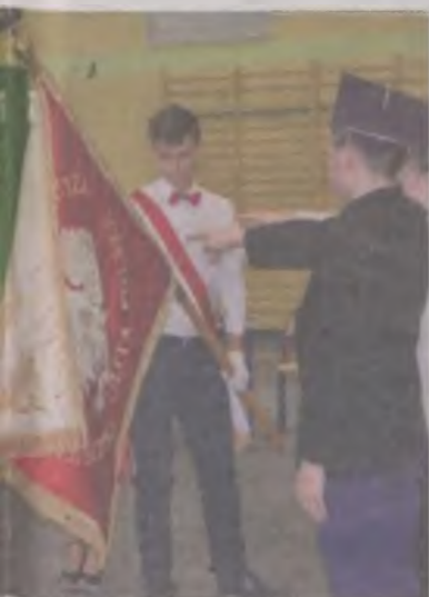
najpewniej ostatni rocznik.

Na koniec ukraińscy goście podziękowali gospodarzom, w których domach goszczą oraz dyrektorowi szkoły, wręczając mu ozdobny talerz z symbolicznym obrazem żyjącej w po-