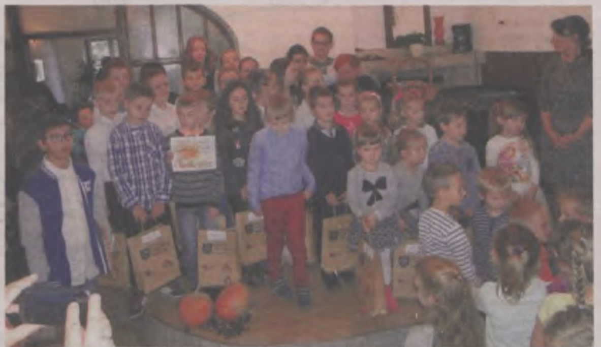
Nagrodzone i wyróżnione przedszkolaki w X Powiatowym Konkursie Plastycznym „Jesienne impresje”.