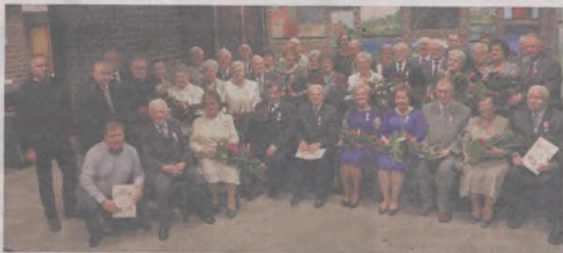
Wspólne zdjęcie - na pamiątkę - jubilatów otrzymani od razu po uroczystości.

wspomnień. O oprawę artystyczną uroczystości zadbała Kapela „Spod Baszty”. Były toasty, wspomnienia i tańce.