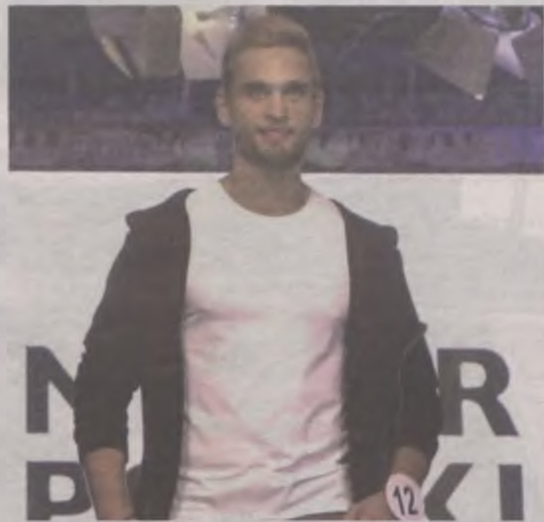
foto. Kadr z transmisji finału Mister Polski 2016