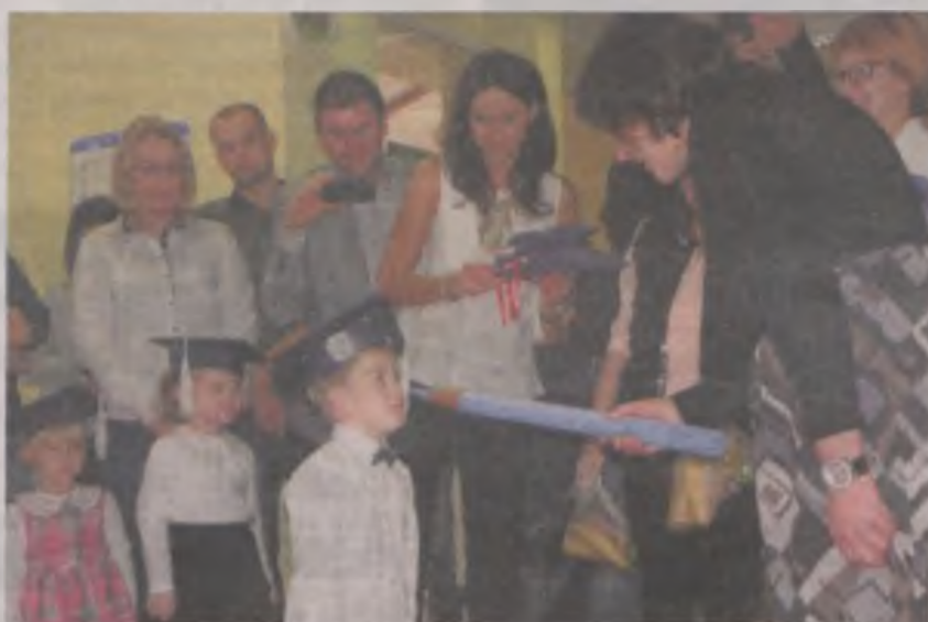
Pasowania dokonywała pani dyrektor z pomocą magicznej kredki.