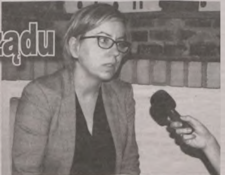
Posłanka .Nowoczesnej z okręgu gnieźnieńsko-konińskiego zadeklarowała sprzeciw wobec zapowiadanej reformy oświatowej

dłużenie funkcjonowania kopalni. W imieniu swojej formacji, posłanka zadeklarowała sprzeciw wobec zapowiadanej reformy oświatowej. Jej zdaniem tak fundamentalne zmiany powinny być przygotowane bardziej gruntownie, jak również rozłożone w czasie.