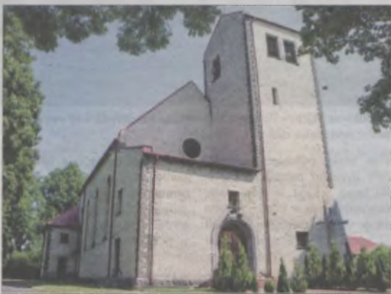
Po raz pierwszy we wspólne obchody włączy się również Parafia w Wieleninie. Tu obchody przypadną na 24-25 lipca, czyli w odpust św. Jakuba Apostoła.

innych krajów europejskich. Podczas dwudniowego kongresu prelegenci z różnych krajów zaprezentują historię układania dywanów z żywych kwiatów, najważniejsze imprezy z tym związane w Europie i ich wpływ