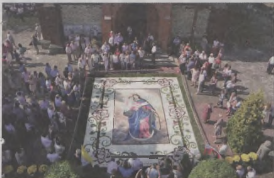
Efekt kilkunastogodzinnych zmagani Włochów oraz parafian był zniewalaający. Na zdjęciu obraz Matki Bożej Pocieszenia z paskiem w Wilamowie.

międzynarodowy kongres poświęcony artystycznemu układaniu obrazów kwiatowych, organizowany przez włoską organizację Infiortalia. Do Uniejowa przyjedzie ok. 100 delegatów z Włoch i innych krajów, w których żywa jest tradycja układania obrazów kwiatowych. Decyzja o organizacji tej imprezy w Uniejowie jest efektem kontaktów, które w ubiegłym roku gmina nawiązała z włoską organizacją. W czerwcu 2015 r. artyści ze Spycimierza ułożyli obraz z kwiatów na placu Świętego Piotra w Rzymie. Dzieło zwróciło uwagę zarówno turystów, jak i organizatorów. W sierpniu 2015 r. goście z Włoch zrewanżowali się ułożeniem obrazu z pyłu kwiatowego przy