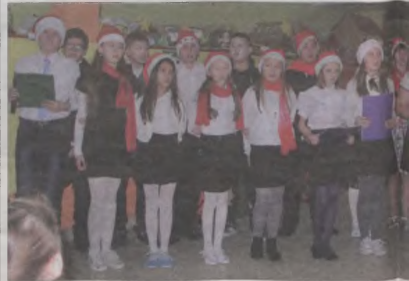
Poszczególne sceny przedstawienia, przeplatano kołędami w chóralnym