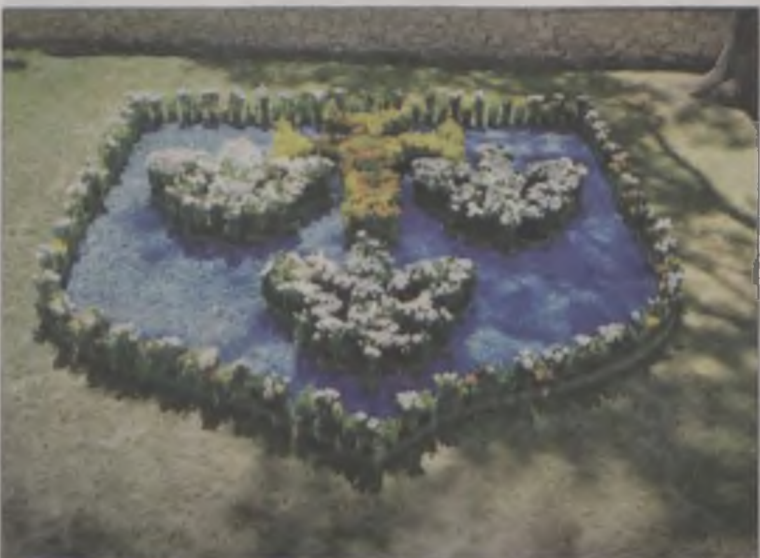
Królestwo Lillii, będące do tej pory częścią Turnieju Rycerskiego, zasili cykl imprez Spycimierskie Boże Ciało. Kompozycje z lillii ozdobią uniejowską Kolegiatę.

międzynarodowy kongres poświęcony artystycznemu układaniu obrazów kwiatowych, organizowany przez włoską organizację Infiortalia. Do Uniejowa przyjedzie ok. 100 delegatów z Włoch i innych krajów, w których żywa jest tradycja układania obrazów kwiatowych. Decyzja o organizacji tej imprezy w Uniejowie jest efektem kontaktów, które w ubiegłym roku gmina nawiązała z włoską organizacją. W czerwcu 2015 r. artyści ze Spycimierza ułożyli obraz z kwiatów na placu Świętego Piotra w Rzymie. Dzieło zwróciło uwagę zarówno turystów, jak i organizatorów. W sierpniu 2015 r. goście z Włoch zrewanżowali się ułożeniem obrazu z pyłu kwiatowego przy