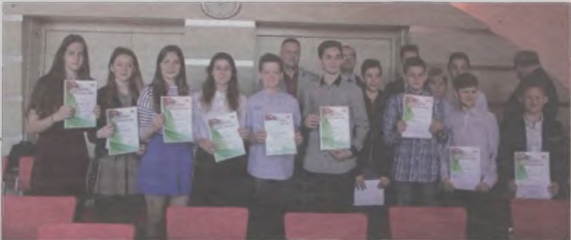
Nagrodzeni sportowcy wraz z burmistrzem i trenerem.