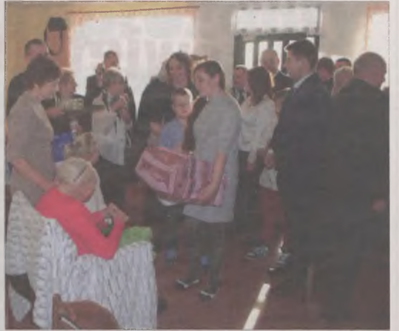
Z życzeniami, kwiatami i upominkami przybyły cztery pokolenia.

tulacyjny powiedział, że jest ona przykładem zaradnej i pracowitej kobiety, która idealnie sprawdziła się w roli matki i babci. Ksiądz proboszcz obdarował jubilatkę obrazem Matki Bożej. Zacytował