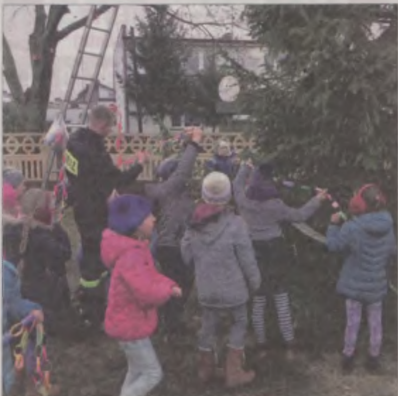
Mieszkańcy Wyszyny ubrali świąteczne drzewko.

Żłóbek, opłatek i choinka to symbole świąt Bożego Narodzenia. Piękne, przystrojone drzewko stanęło też przy remizie OSP w Wyszynie.