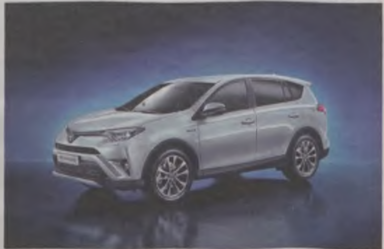
Toyota RAV4 Hybrid

zwraca się już po przejechaniu około 50 tys. kilometrów. Okazuje się, że podczas jazdy przez zakorkowane miasta w godzinach szczytu zużycie paliwa w toyotach hybrydowych jest bezkonkurencyjnie niskie w porównaniu do silników benzynowych czy wysokoprężnych. Nawet upowolniony kierowca nie daje tak dobrych efektów pod względem zużycia paliwa! Niskie koszty przejazdu zapewnia w hybrydzie silnik elektryczny, który przy ruszaniu oraz niskich prędkościach rozpędza samochód. Silnik spalinowy natomiast włącza się przy wyższych prędkościach i w przypadku konieczności