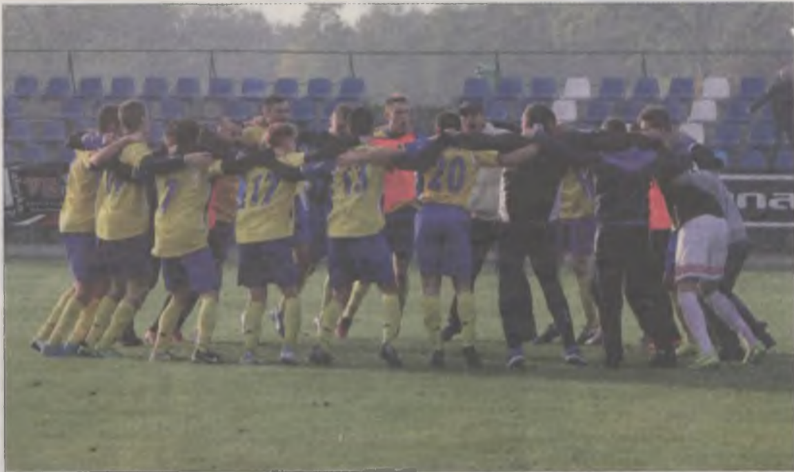
Pilkarze Wichru Dobra są liderem ligi okręgowej. Czy również na zakończenie sezonu będą mogli wykonać taki taniec radości?

W rozgrywkach A klasy grają jeszcze dwie ekipy z naszego powiatu. W Gromie Malanów grudzień stał pod znakiem wyborów nowego zarządu. Zmian nie było