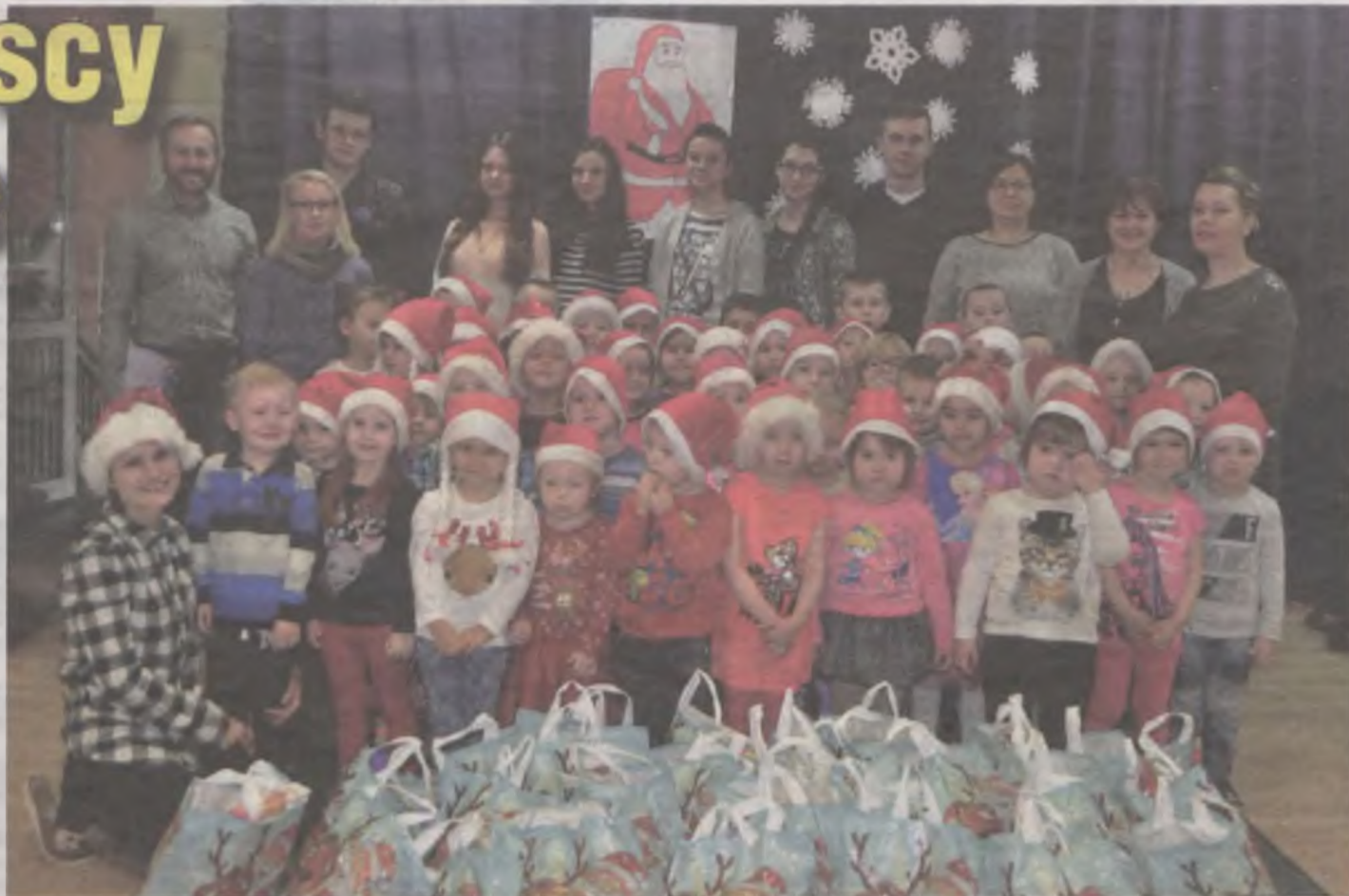
Przedkolaki biorące udział w brudzewskiej akcji „Pogotowie św. Mikołaja”.