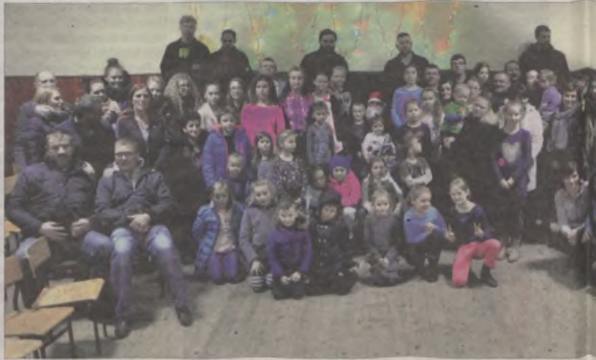
Wieczorem wspólnie świętowali i podziwiali swoje dzieło.