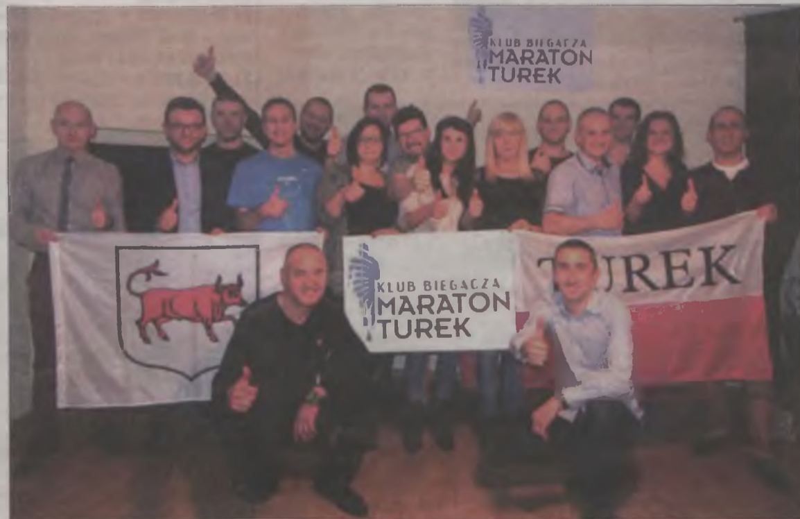
Komitet założycielski Klubu Biegacza Maraton Turek w pełnym składzie.

niejsze, iż będą oni mieli szansę szlifować swoje umiejętności pod okiem dużo bardziej doświadczonych kolegów. Dość powiedzieć,