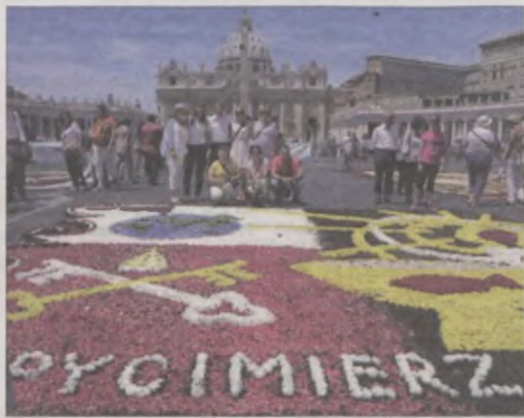
Delegacja gminy Uniejów promowała spycimierskie święto w Watykanie.

go przy kościele parafialnym w Wilamowie. Duże zainteresowanie turystów i zaangażowanie miejscowych artystów skłoniły władze Uniejowa do organizacji cyklu imprez kwiatowych w 2016 r. pod wspólną marką „Spycimierskie Boże Ciało”. W planach