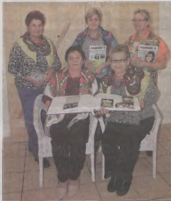
Gminna Rada KGW z kroniką.

Dla „Razem” nie były to jednak pierwsze występy. Zespół działa już od 2009 roku. Jego założycielkami były panie z Galewa, Janiszewa i Krwon, do których dołączyły później mieszkanki Bogdałowa, Chrząblic i Tarnowej. W składzie grupy jest obecnie 14 artystek, co daje wiele możliwości podczas wspólnych występów.