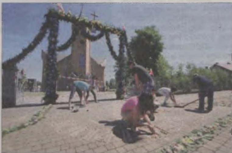
Spycimierskie dywany są bazą cyklu wydarzeń, ale od teraz również inne parafie z terenu gminy będą miały swoje kompozycje.

27-28.08.2016 r. – „Spycimierskie Boże Ciało 2016” – Dzieło z pyłu kwiatowego – Obraz Św. Wojciecha przed Kościołem w Wilamowie w wykonaniu artystów z Włoch.