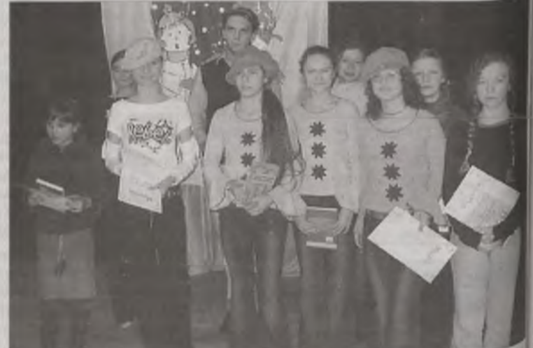
Laureaci konkursu „Oskard” w Koninie. Organizatorami imprezy był Urząd Miejski w Turku, Miejski Dom Kultury w Turku oraz Centrum Kultury, Sztuki w Koninie, które było datorem nagród.

Wszyscy uczestnicy eliminacji powiatowych otrzymali pamiątkowe dyplomy i upominki. Zwycięzcy zaśpiewają podczas XXIII Międzypowiatowego Festiwalu Piosenki Dziecięcej i Młodzieżowej, który odbędzie się 19 marca w Górnicyz Domu Kultury