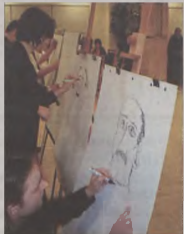
Jak by najładniej narysować naszego Jędrusia

nym konkursie na najlepszą karykaturę właścicieli. Zabawa trwała do rana. a