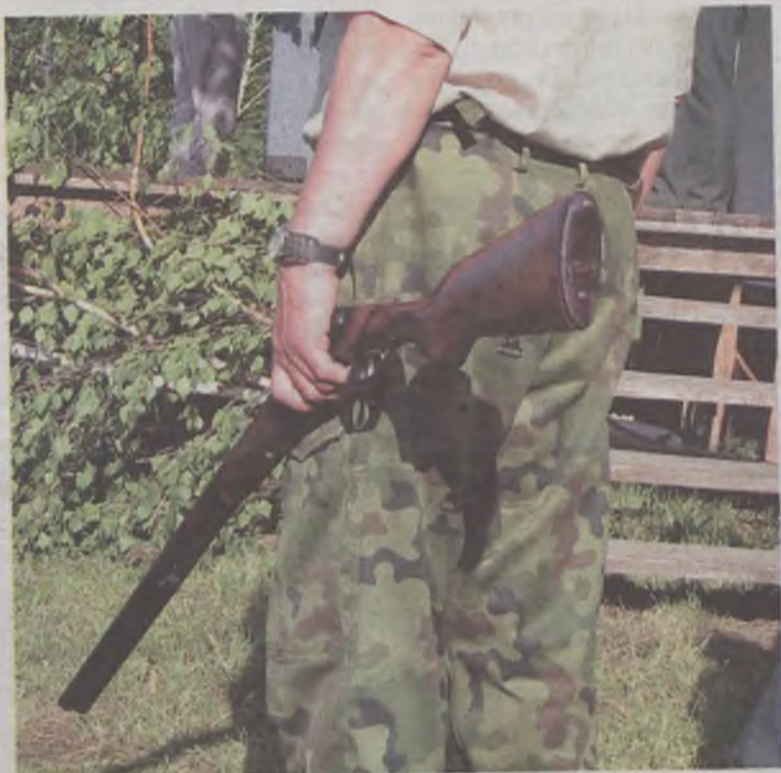
Czy myśliwi będą strzelać do dziczących psów?

W powiecie tureckim poważnym problemem stały się watahy bezpańskich, dziczących psów. Czworonogi zagrażają nie tylko ludziom, ale atakują zwierzęta leśne, a nawet domowe. Po konsultacjach z przedstawicielami kół łowieckich i nadleśnictwa, starosta turecki wydał zezwolenie na strzelanie do dziczących psów i kotów.