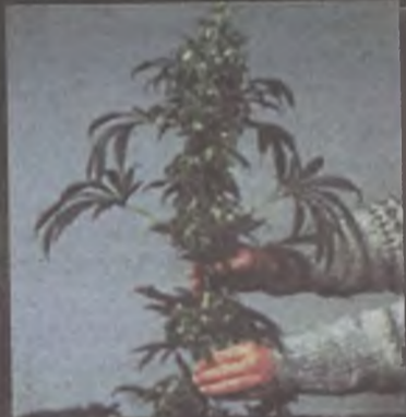
W Turku mężczyzna hodował kilkadziesiąt krzaków konopi indyjskiej.

Aresztowany mężczyzna ma podwójne obywatelstwo. Jest Holendrem urodzonym w Iraku. Ma 24 lata. Od pewnego czasu prze-