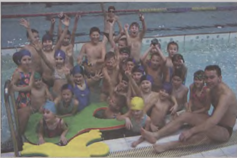
Na turkowskiej pływalni