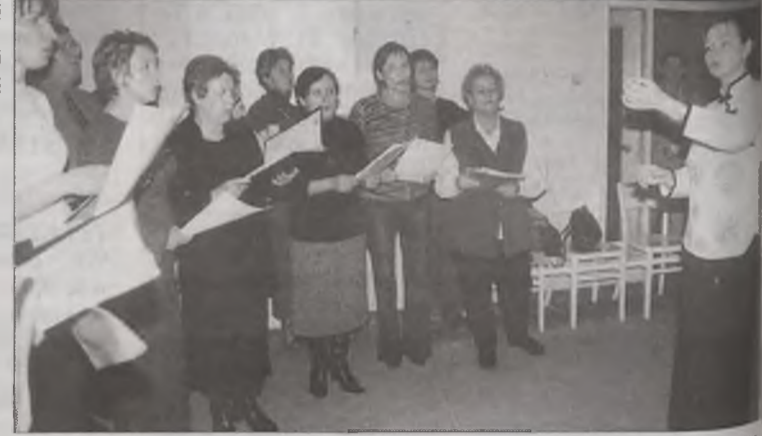
Dla pacjentów turkowskiego szpitala kilka piosenek ze swojego repertuaru zaśpiewał chór nauczycielski Turkowskiego Towarzystwa Chóralnego. Pieśni rozbrzmiewały szczególnie na oddziale wewnętrznym. Trzeba przyznać, że pacjenci byli zaskoczeni wizytą chórzystów.

W Miejskim Domu Kultury w Turku odbyły się eliminacje powiatowe do XXIII Międzypowiatowego Festiwalu Piosenki Dziecięcej i Młodzieżowej.