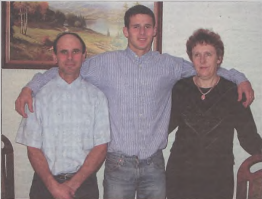
Z rodzicami w domowych pieleszach po powrocie z Iraku