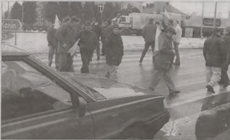
Czy w tym roku rolnicy znów wyjdą na drogi powiatu tureckiego, tak jak to było w lutym ubiegłego roku?

-Na razie przynajmniej w naszym powiecie nie planujemy takowych, ale i nie wykluczamy podobnego scenariusza wydarzeń. Pewne rozstrzygnięcia mogą nastąpić po drugim lutego, kiedy to