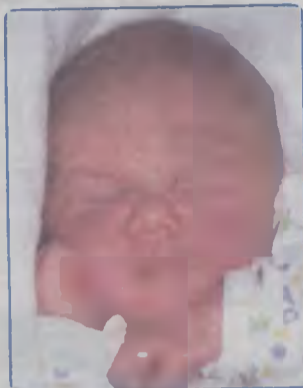
... KROTOWSKI syn Beaty i Piotra ur. 17 stycznia, godz. 19.20 wazył 3900g, mierzył 56cm