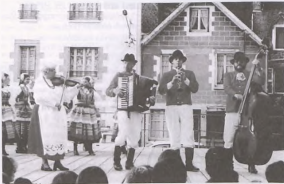
Gra kapela zespołu folklorystycznego „Marynia”