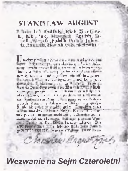
Wzwanie na Sejm Czteroletni

- ustawodawczą , którą miał sprawować sejm o dwuletniej kadencji „zawsze gotowy”, składający się z izby poselskiej i izby senatu. Sejm podejmował uchwały większością głosów;