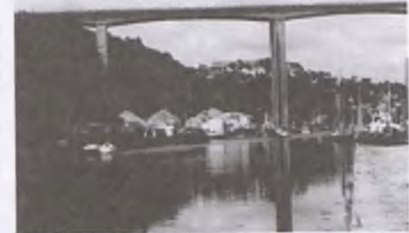
Kanał portowy w Plerin