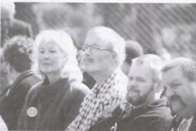
Holendrzy bywają częściej we Wronkach i biorą udział w lokalnych uroczystościach.

Podpisanie tego dokumentu poprzedziła długoletnia współpraca, sięgająca 1981 roku, kiedy to dwa holenderskie stowarzyszenia charytatywne zaczęły świadczyć pomoc humanitarną wronieckiemu społeczeństwu: Ijmond Pomaga Polsce (późniejsza Fundacja Pomocy