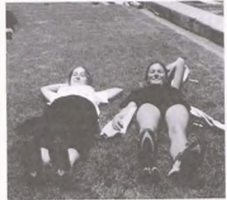
Opalanie na trawie