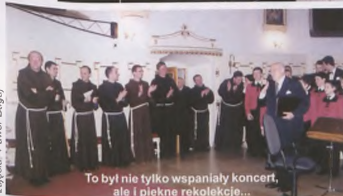
To był nie tylko wspaniały koncert, ale i piękne rekolekcje...