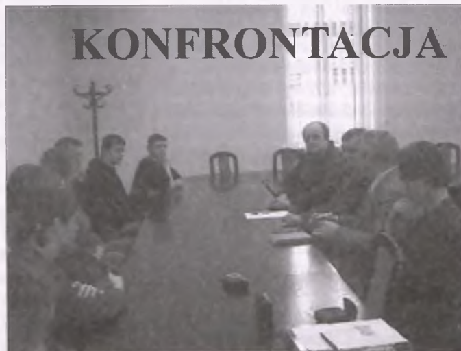
Przedstawiciele grupy inicjatywnej prezentują swój pomysł wiceburmistrzowi w Urzędzie Miasta i Gminy Wronki