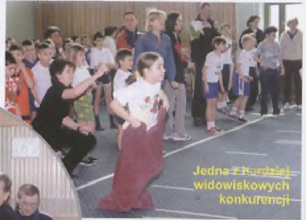
Jedną z bardziej widowiskowych konkurencji