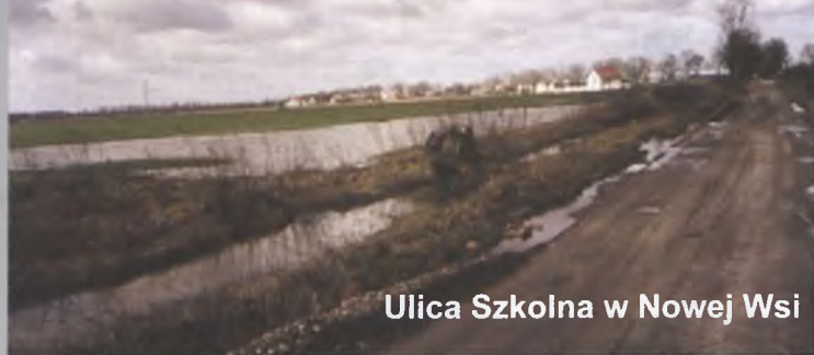
Ulica Szkolna w Nowej Wsi