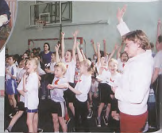
▲ Gospodarze turnieju - uczniowie SP 2 - jednym punktem przegrali „Misia”; w dogrywce o drugie miejsce pokonali rówieśników z Nowej Wsi