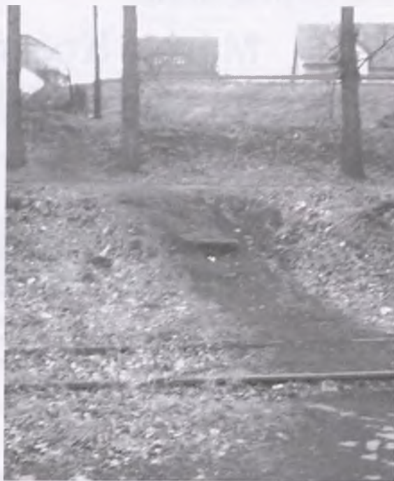
W tym miejscu mają powstać schody

Część radnych wniosowała, aby położyć tylko chodnik a budowę schodów odłożyć do momentu otrzymania stano-