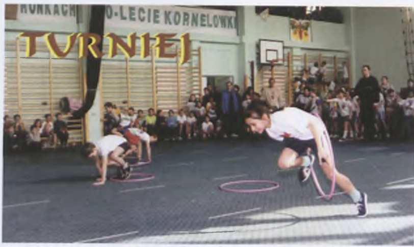
▲ Na starannie przykrytym parkiecie sali gimnastycznej SP 2 rywalizowali najmłodsi uczniowie szkół podstawowych gminy Wronki