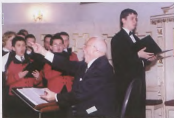
Haendel, Mozart ... Stuligrosz na solo, sopran i baryton, chór i organy