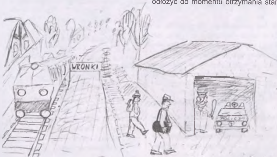
rys. K. Kur(a)