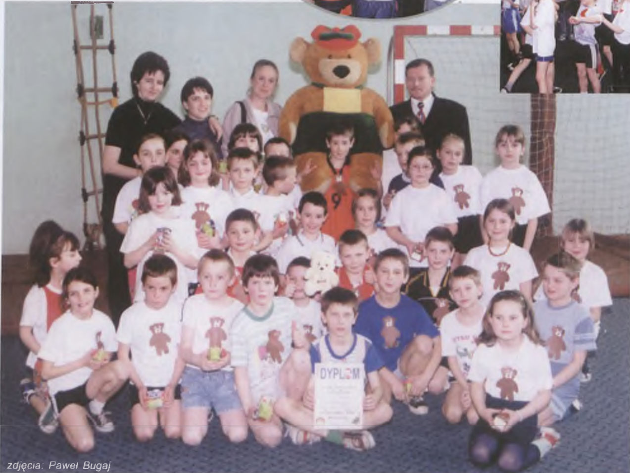
◀ Szczęśliwi zwycięzcy - uczniowie i ich opiekunowie ze Szkoły Podstawowej w Biedzdrowie z podwójnym trofeum