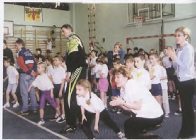
▲ Emocje nie opadały do ostatniego gwizdka