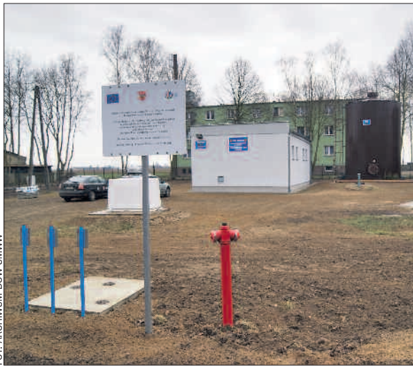
W ramach PROW 2007-2013 w Wielkopolsce wybudowano łącznie około 2220 km sieci wodociągowej i kanalizacyjnych, 290 oczyszczalni ścieków oraz 2785 przydomowych oczyszczalni ścieków. Nowy program wspiera dalsze inwestycje gmin w gospodarkę wodno-ściekową.

O tym, kto z wnioskodawców otrzyma pieniądze na realizację swoich inwestycji, zdecyduje kolejność na liście rankingowej,