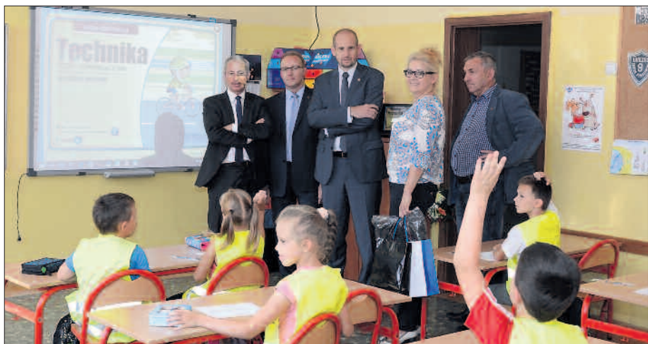
W pracowniach uczniowie korzystają z nowoczesnego sprzętu multimedialnego.

W Wielkopolsce odbyło się kilka wydarzeń, w których wzięli udział młodzi cykliści.