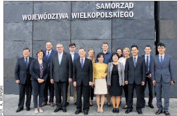
Udział w targach i rozmowy o naszych doświadczeniach w rolnictwie były celem wizyty ekspertów z Korei Południowej.

Podczas targów tradycyjnie już nie mogło zabraknąć wielkopolskich propozycji wśród nagrodzonych. Produkty z naszego województwa znalazły się zarówno wśród laureatów PEREL 2016 – nagród w konkursie „Nasze Kulinarne Dziedzictwo – Smaki Regionów” (konfitura cze-