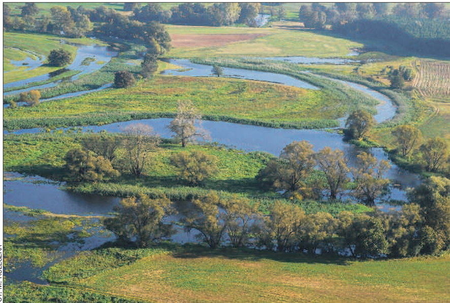
Cztery z wielkopolskich parków krajobrazowych chronią fragmenty doliny Warty, w tym liczne starorzecza, jak w okolicach Rogalina.

Większość parków naszego regionu leży w zasięgu zlod-