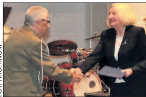
Przewodnicząca pogratulowała prezesowi związku.

Związek Oficerów Rezerwy RP im. Marszałka Józefa Piłsudskiego świętował jubileusz.