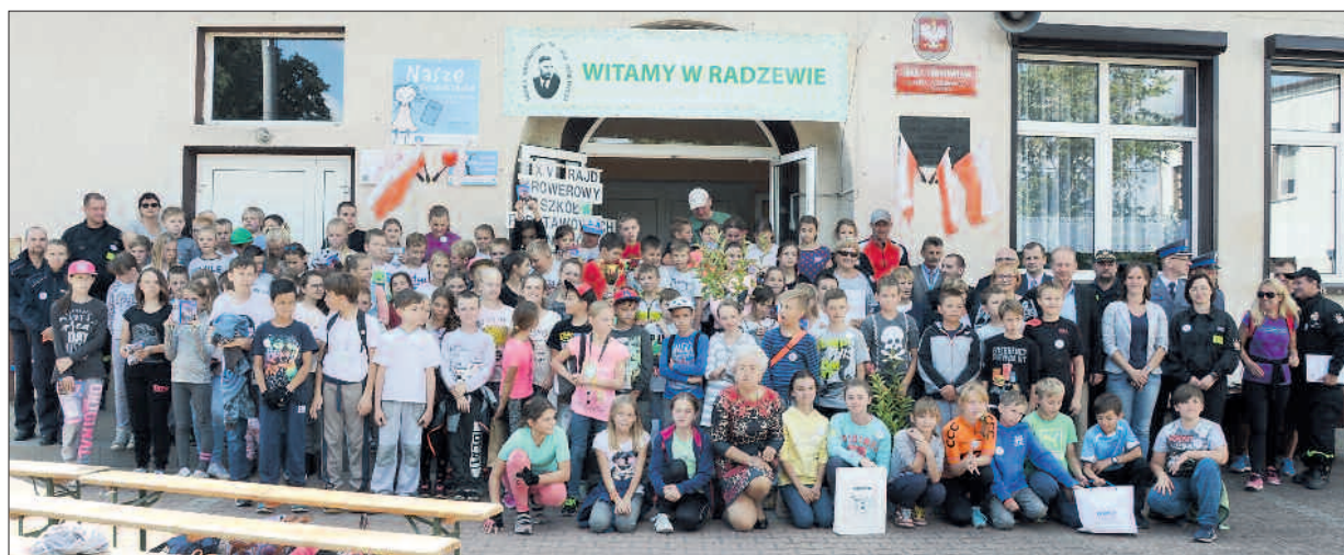
Jubileuszowy, XV Gminny Rajd Rowerowy do Radzewa odbył się 22 września.