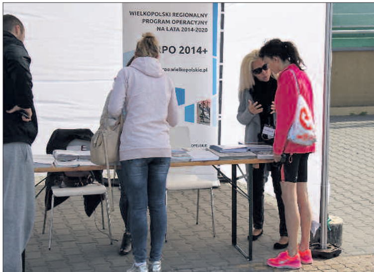
Wielu uczestników imprezy dopytywało o fundusze z UE.

wiadali o swych doświadczeniach związanych z pozyskaniem wsparcia z Unii Europejskiej. Była to także okazja do zaprezentowania swoich projektów, które obecnie służą mieszkańcom Wielkopolski.