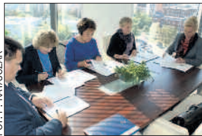
Centrum mediacji wspólnie tworzy pięciu partnerów.

22 września w Urzędzie Marszałkowskim w Poznaniu odbyła się konferencja poświęcona tym zagadnieniom. RAK