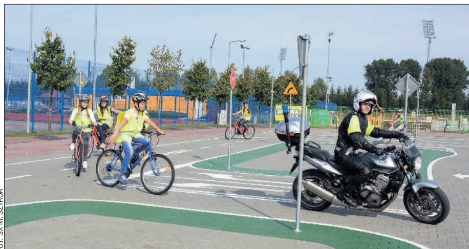
Obok szkolnego boiska powstała sieć ulic i skrzyżowań ze znakami drogowymi i światłami.

23 września otwarto np. duże miasteczko ruchu drogowego w Grodzisku Wlkp. Obiekt zlokalizowano przy miejscowym Centrum Sportu, w pobliżu Szkoły Podstawowej