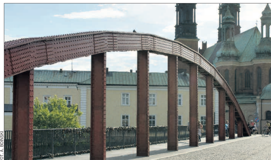
Najstarszy most Poznania – Cybiński – został odbudowany w 2007 roku. Dziś owa przeprawa, nazwana imieniem biskupa Jordana, jest bardzo popularnym miejscem spacerów, imprez, wyraźnie ozdabia tę część miasta.

Jednym z najmłodszych poznańskich mostów jest most Królowej Jadwigi. Miasto bardzo potrzebowało połączenia drogowego z Ratajami, przeprawa łodziami (doskonale pamiętana przez starszych mieszkańców) była tylko prowizorycznym rozwiązaniem.