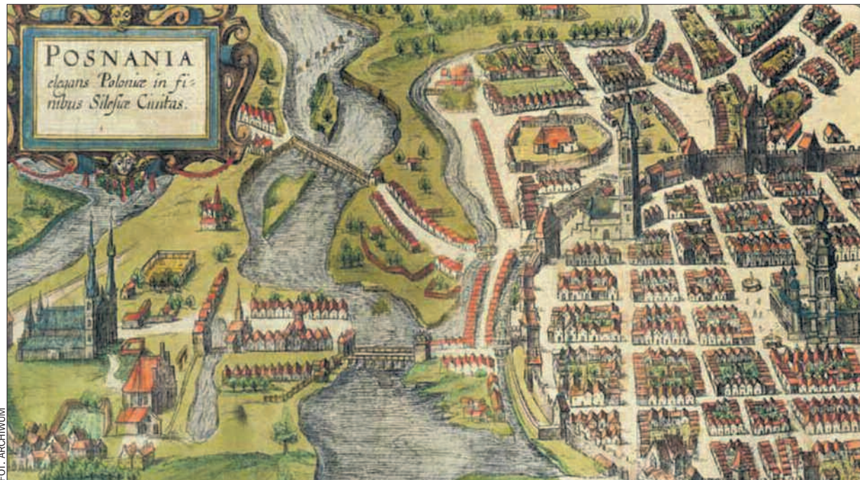
Ostateczny układ poznańskich mostów utrwalił się w drugiej połowie XIV wieku. Najważniejsze z nich widać doskonale na słynnej rycinie Brauna i Hogenberga z 1618 roku.

Jednak dla życia i rozwoju Poznania znacznie ważniejsze były inne mosty, powstałe po lokacji miasta w 1253 roku. Powstawały i były niszczone. Budowane były z drewna – nietrwałego materiału, bardzo wrażliwego na zmiany pogody, pór roku, intensywne zużywanie w trakcie ruchu, a przede wszystkim na po-