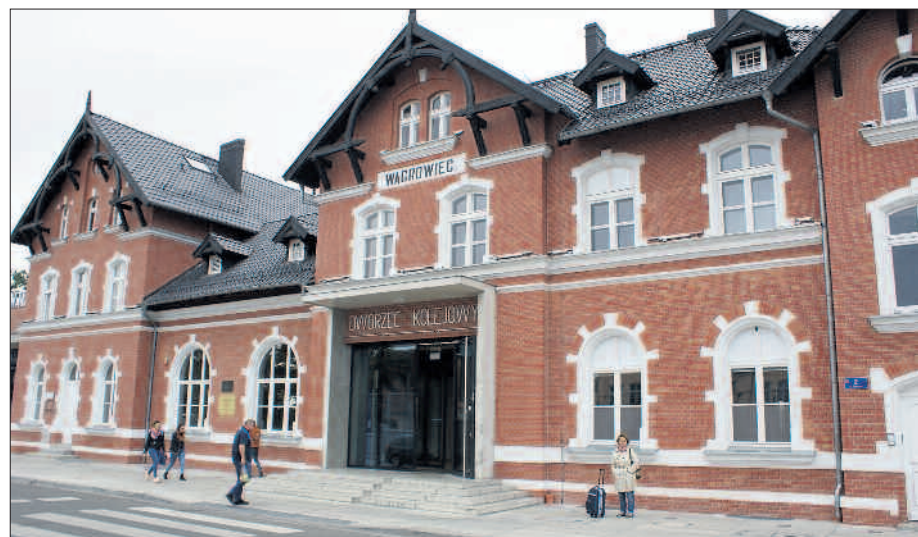
Perony i dworzec kolejowy odnowiono niedawno m.in. w Wągrowcu.