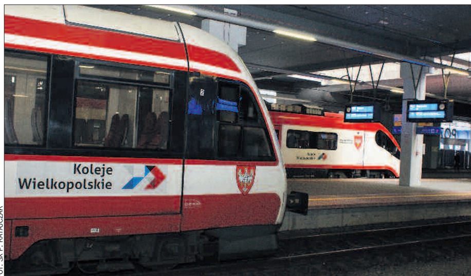
Pociągi w aglomeracji poznańskiej mają kursować co pół godziny.

Pewnie mogłyby jeździć częściej, ale brakuje składów, by obsłużyć wzrastającą liczbę pasażerów kolei. Z analiz wynika, że już teraz moglibyśmy wykorzystać około 20 dodatkowych pociągów, a docelowo potrzebne będą 32-34 nowe składki. Dzięki funduszom z UE jest szansa, że część z nich wyjedzie na