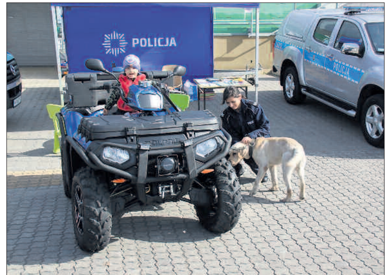
Zainteresowaniem cieszył się m.in. policyjny sprzęt.