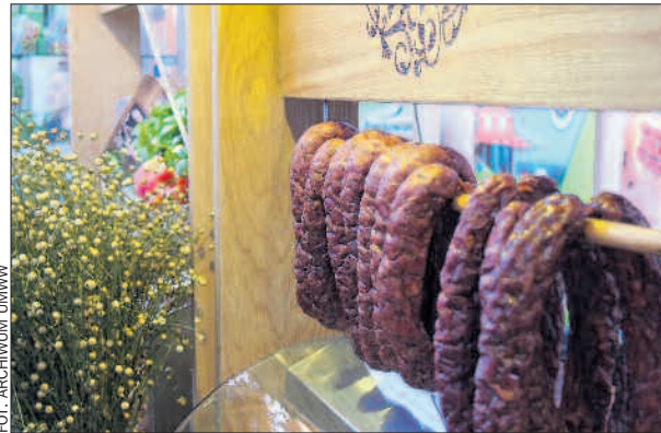
Takie smakołyki kusily odwiedzających wielkopolskie stoisko podczas targów Smaki Regionów.

Wielkopolska żywność, zwłaszcza produkowana według tradycyjnych receptur i z regionalnych składników, zyskuje na popularności.