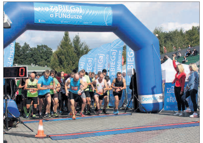
Start obu biegów nastąpił krótko po godzinie 13.

Sobotnie wydarzenie pn. „zaBIEGaj o FUNdusze” było pierwszą, ale prawdopodobnie nie ostatnią edycją imprezy łączącej aktywność ruchową i dobrą zabawę w plenerze z promocją możliwości uzyskania wsparcia z dotacji unijnych. Urzędnicy już zastanawiają się nad organizacją podobnej akcji w 2017 r., zwłaszcza że niektórzy z uczestników jeszcze w trakcie imprezy pytali, czy będzie ona miała swoją kontynuację. PIT