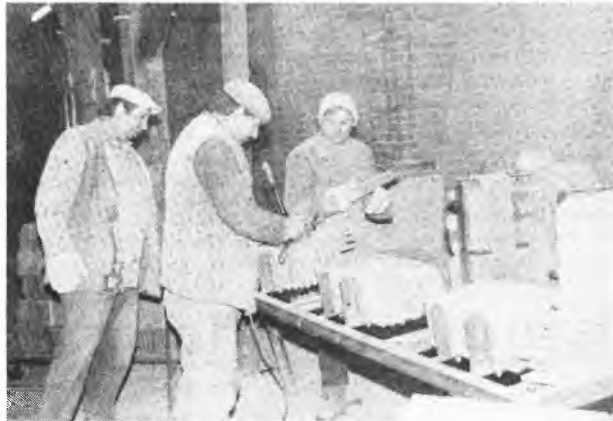
Pracownicy cegielni przy produkcji dachówki. Zdjęcie sprzed roku.