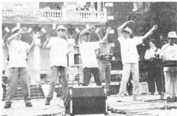
Zdobycia I miejsca na festiwalu piosenki zespół z DPS w Broniszewicach

Zadbano także o to, by nikt nie był głodny. Od godz. 12.00 przez całe popołudnie wydawano grzochówkę i bigos. W świetlicy można było wypić gorącą kawę lub herbatę. Mimo