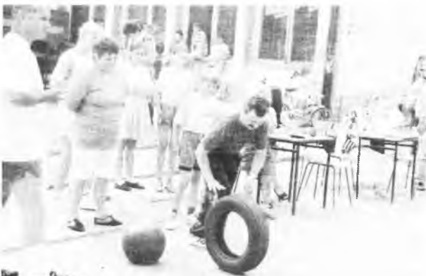
Jedna z konkurencji - toczenie opony.