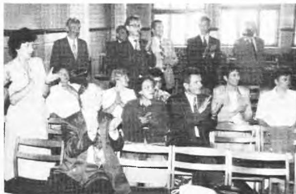
XI d w czasie oficjalnej uroczystości w auli.