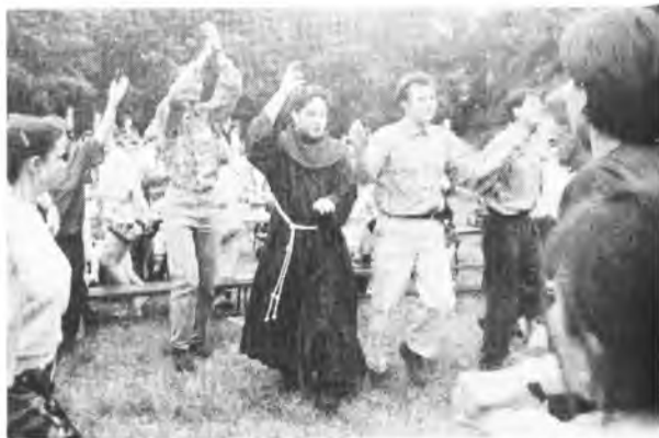
Ojciec Oktawiana chętnie włączył się do tanecznego kregu

Jedną z największych atrakcji zakrzewskiej Integracji były pokazowe