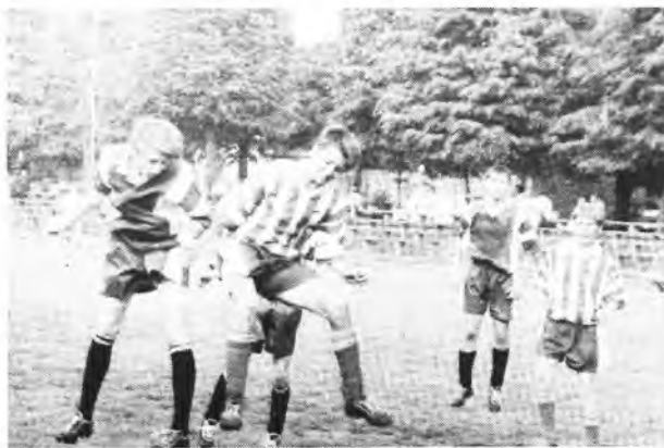
Po remisie w Ostrowie spodziewaliśmy się, że drużyna Victorii, grająca w klasie Kuchara, pokona w Jarocinie rywali i zdobędzie mistrzostwo województwa

ny rezultat do końcowego gwizdka sędziego, zwłaszcza, że kilku piłkarzy najwyraźniej włożyło większość swoich sił w zdobycie jak największej