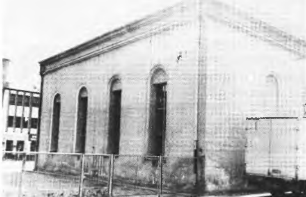
Synagoga jarocińska - dzisiaj sala gimnastyczna ZSZ Nr 2.

W 1797 r. Ignacy Radoliński wydał przywilej dla krawców żydowskich, których było 22.