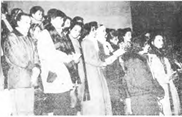
Młodzi śpiewają kolędy