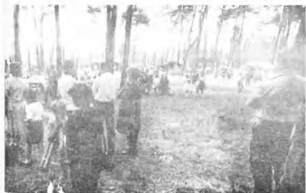
Ok. godz. 19.00 było już kilkadziesiąt osób.

To największe wydarzenie w okolicy odbywa się co roku w Nowym Mieście nad Wartą. Tradycja sięga daleko wstecz. Jak mówią mieszkańcy, impreza ta odbywała się zawsze, jak tylko pamiętają. Przez kilkadziesiąt lat jej organizacją zajmowali się strażacy.