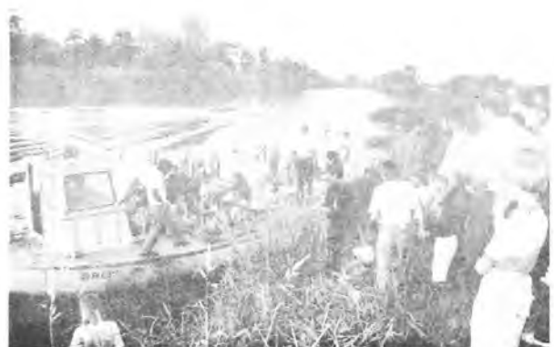
Czas oczekiwania można było sobie unilic kilkuminutowym rejsom po Warcie.

Ostatnimi laty aura im nie sprzyjała; co impreza to ulewa. "Pałeczkę" przejęła nowomiejska szkoła. Strzał w 10-kę. Zarzucić tradycję - szkoda. Jest to też okazja do podreperowania szczyplęgo szkolnego budżetu. Jednak nie nie ma za darmo - impreza kosztuje a koszt ten to praca. Nauczycielom i rodzicom zapa-