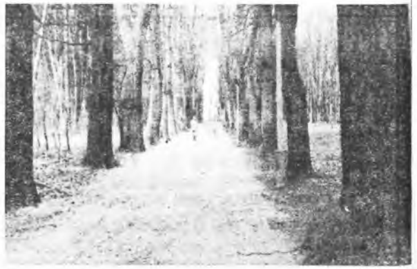
Aleja dębu czerwonego

stwierdzić, że jest ona ewenementem przyrodniczym z uwagi na jej długość i rozwidlenie. W miejscu rozwidlenia, obecnie nieco zatartego i zmienionego, bierze początek następna aleja grabowa, biegnąca równolegle wzdłuż wschodniej i północnej granicy parku. Dodatkowy, wyjątkowy akcent kompozycyjny i widokowy, stanowi aleja dębu czerwonego, sąsiadująca ze wspomnianymi alejami grabowymi. Po lewej stronie tych alei rozciąga się drzewostan o charakterze lesnym, gdzie dominuje świerk pospolity, grab zwyczajny, robinia akacjowa, dąb szypułkowy i lipa drobnolistna. Idąc w kierunku południowo-zachodnim spotykamy usypany kopiec ziemny oraz małe polany widokowe, w pobliżu których znajdują się zadrzewienia o charakterze parkowym. Uważny obserwator dostrzeże w tej części parku grupę okazów sosny wejmutki, potężne pomnikowe dęby i jesiony, a także cyprysik nutkajski, pigwowiec japoński oraz niepozorny kasztan jadalny. Z krzewów występuje jaśminowiec wonny, śnieguliczka biała i głóg jednoszyjkowy oraz bez-