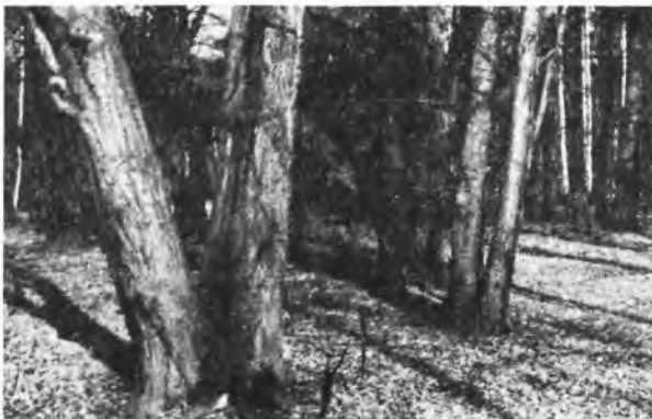
Grupa sędziwych dębów