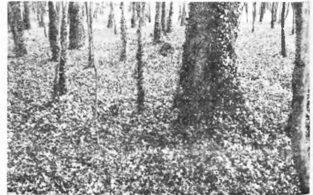
Zmarte stanowisko bluszcza pospolitego

czarny i bez lilak. Miejscami można odnaleźć okazy modrzewia europejskiego i kilku gatunków oraz buk zwyczajny. Wychodząc na dużą, ładnie utrzymaną polanę widokową z dzieciną łatwością zauważymy neogotycki pałac Radolińskich. Oprócz elegancko utrzymanych pomieszczeń można podziwiać śliczny taras widokowy, znajdujący się po stronie elewacji ogrodowej budynku. Od strony frontowej pałacu w kierunku ul.