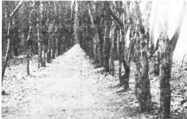
Fragm. alei grabowej

leżnicy, i obejrząc w drugim stawie lustrzane odbicie elewacji ogrodowej pałacu. W chwili zadumy możemy zobaczyć, że z każdym dniem na naszych oczach niszczeje dobro kultury narodowej i przyrodniczej. Pomimo licznych trudności i braku zdecydowanych działań park stanowi nadal zielone płuca miasta. Tworzy swego rodzaju, rzadko