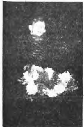
Wylowienie wianka z Warty nie było prostą czynnością.

To największe wydarzenie w okolicy odbywa się co roku w Nowym Mieście nad Wartą. Tradycja sięga daleko wstecz. Jak mówią mieszkańcy, impreza ta odbywała się zawsze, jak tylko pamiętają. Przez kilkadziesiąt lat jej organizacją zajmowali się strażacy.