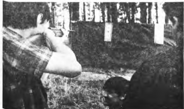
Prawdziwie męskie sporty na łędzie.

Ostatnimi laty aura im nie sprzyjała; co impreza to ulewa. "Pałeczkę" przejęła nowomiejska szkoła. Strzał w 10-kę. Zarzucić tradycję - szkoda. Jest to też okazja do podreperowania szczyplęgo szkolnego budżetu. Jednak nie nie ma za darmo - impreza kosztuje a koszt ten to praca. Nauczycielom i rodzicom zapa-