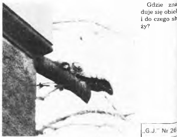
„G.J.” Nr 26

Gdzie znajduje się obiekt i do czego służy?