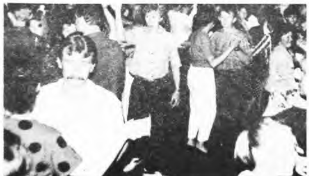
Ruszono w tany.