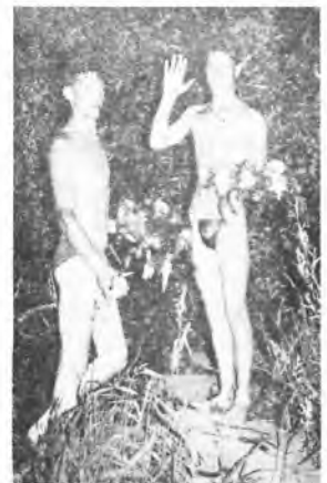
Dwaj z 16-tu odważnych młodzian z trofeami.

Nadchodzi właściwa pora. Piurny zaczynają gromadzić się na nabrzeżu. Nad głowami pojawiają się pojedynczo sztuczne ognie. Czuje się atmosferę oczekiwania. Już czas. Pojawiają się dziewczynki w bieli z wiankami. Płyną łodzią w górę rzeki, zapalają ogień na wiankach, śpiewają. Uwaga!...pierwsze wianki poszły na wodę, widać na niej tylko ogniki. W gorze widowisko - fajerwerki. Na ostrogach rzeki czekają już chłopczy, pierwsi skaczą do wody. Są następne wianki i następni "łowcy". Naliczyliśmy ich 16-tu. Niestety dla jednego z nich zabrakło wianka - może w przyszłym roku. Kończy się fascynująca i niebezpieczna część wieczoru.