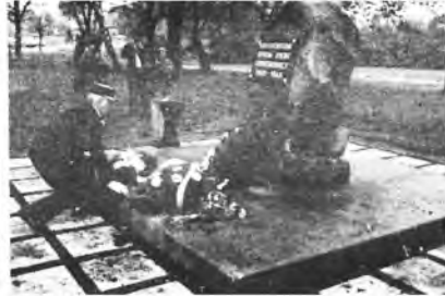
Delegacja Libercourt w Parku Zwycięstwa