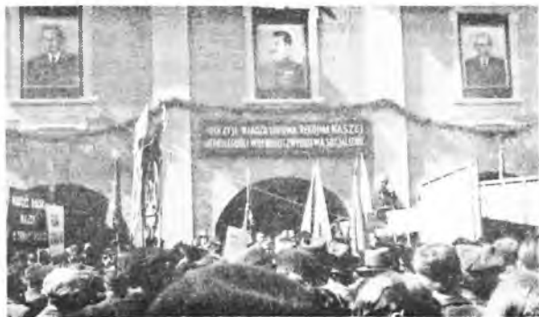
Czterdzięci lat temu w Jarocinie...

Dowodzi to, że w maju nawet najbardziej zatwardziali rewolucyjniści ulegają romantycznym porywom, w konsekwencji nie chce im się pracować. Zapewne dlatego od 1890 roku postanowiono zafundować sobie dzień wolny od pracy, czyli dzień świąteczny, przekornie nazwany później Świętem Pracy.