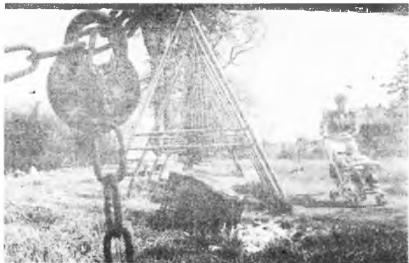
Ogródek jordanowski przy ul. Św. Ducha

Doktor Henryk Jordan, założyciel pierwszego w Polsce i jednego z pierwszych w Europie placu zabaw dla dzieci, przewróciłby się chyba w grobie, gdyby wiedział jak wygląda plac zabaw w parku miejskim w Jarocinie.