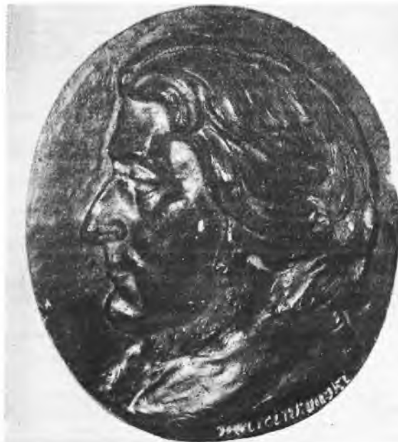
Medalion z pomnika A. Mickiewicza w Śmiełowie - 1931 r.