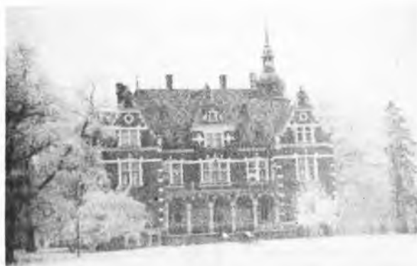
Pałac w Zakrzewie w stylu renesansu niemieckiego.

Ze względu na wysokie walory przyrodnicze i ekologiczne należy zachować układ parku w jego dotychczasowych pierwotnych granicach oraz, w miarę możliwości, powiększyć strefę ochrony ekologicznej we wszystkich kierun-