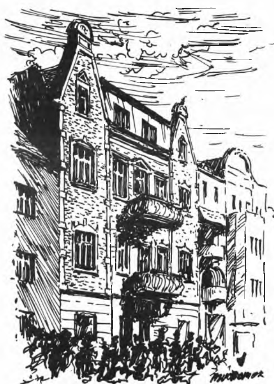
Jarocin, ul. Wrocławska 9. Budynek datowany na koniec XIX w.