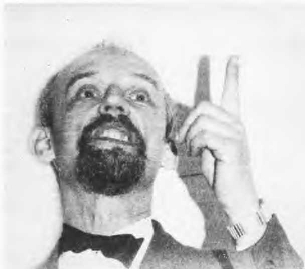
W trakcie spotkania w JOK-u.