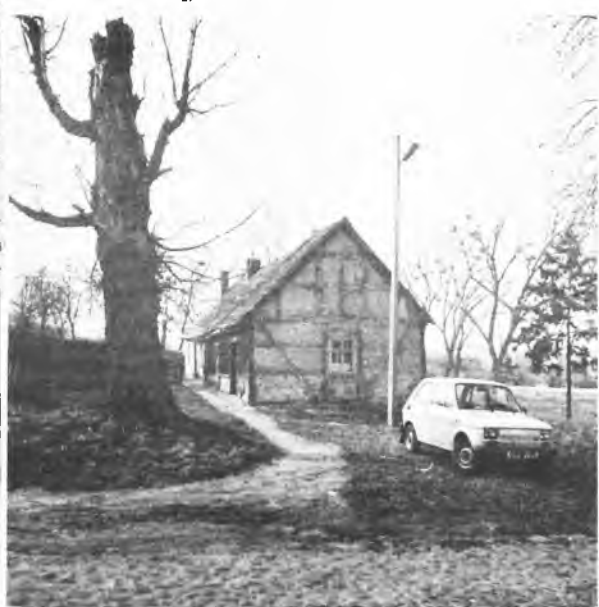
Obecnie niektórych stać już na samochód, ale nie stać na mieszkanie...