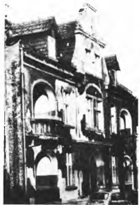
Building przy ul. Hallera