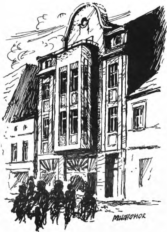
Jarocin, ul. Wrocławska 1. Budynek datowany na początek XX w.