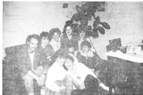
Młodzież z chóru odwiedza panią Emilię w domu

prawda zostawić nas same, ale... miał zbytnie wiele informacji do przekazania. Ich dom po prostu żyje pracą w chórze - próbami, organizowaniem imprez i wyjazdów, mąż pomaga żonie nie zrażony tym, że to ona pełni eksponowaną funkcję. E. Zdrojowa (rok urodzenia - jak w przypadku wszystkich kobiet - nieznany) pracu-