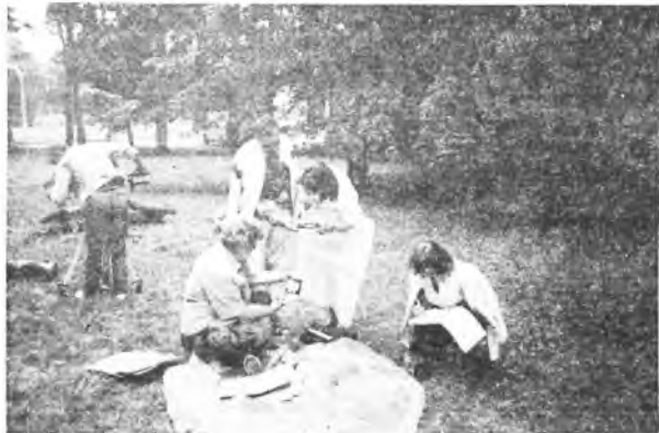
Program dla telewizji nakręcono w parku

W ubiegłym roku najwięcej pracy wymagało zorganizowanie obchodów studenci chóru, któremu poświęcono nawet program w telewizji. Pani Emilia mile go wspomina, ponieważ nakręcono go na łonie natury - w parku. Wyeksponowanie niektórych materiałów, wypożyczonych z muzeum, w tych warunkach było prawdą nieco uciążliwe, ale występujący uniknęli stresującego pobytu w studiu. Być może to występ w telewizji wpłynął