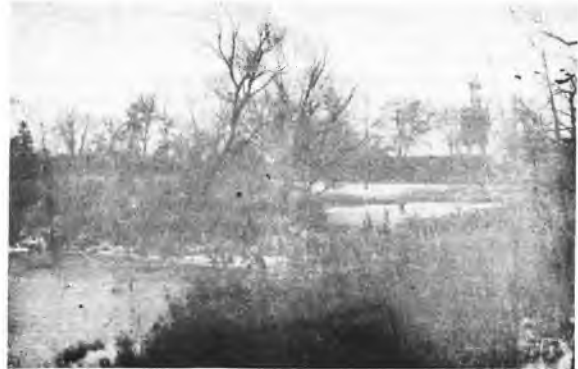
Fragment parku w Parzewie.