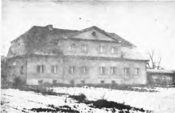
Dwór w Parzewie.

intensywnie rosnącej kilkunastoletniej topoli czarnej co jest niezgodne w wcześniejszym założeniu parkowym. Od strony wschodniej latwo można dostrzec rząd okazałych kasztanowców czekających na uznanie za pomniki przyrody. Na olbrzymiej polanie, przypominającej obecnie gołą łąkę znajdują się cztery grusze,