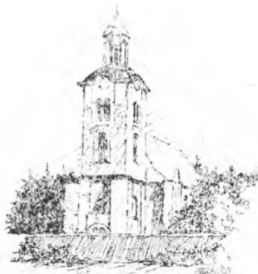
Późnobarokowy kościół pod wezwaniem św. Wawrzynca w Mieszkowie

Mieszkańcy utrzymywali się z bardzo różnych profesji. Część żyła z rolnictwa, o czym świadczy ilość inwentarza (9 koni, 40 krów i 40 świń). Przeważali jednak rzemieślnicy. Było między innymi: 10 piekarzy, 9 rzeźników, 8 płócienników i również tyłu szewców, 7 krawców, 4 bednarzy i tyłuł garnarczyk oraz tkaczy, 3 kuśnierzy i po 2 kowali, siodlarzy oraz po 1 farbiarzu, potaszniku, introligatorze, murarzu, wylwórcy gwoździ i kołodzieju. W mieście było również 8 wiatraków, garbarnia i cegielnia.