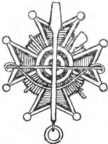
Krzyż członkowski Zjednoczenia Kurkowych Bractw Strzeleckich Rzeczypospolitej Polskiej

bezpieczeństwa mieć mogły, do której i nauka strzelecka nie mniej jest potrzebna przeto (...) w pomienionym mieście Bractwo Strzeleckie fundować pozwoliliśmy”.