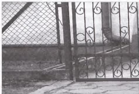
Niezdolne z prawem odprowadzenie wód deszczowych (ul. Poznańska)

Urząd Miasta zwraca się o zlikwidowanie spływów wód na ulice, celem uniknięcia sankcji.