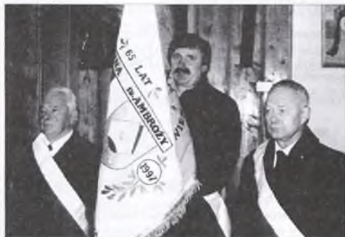
Sztandar Koła towarzyszy ważniejszym uroczystościom...