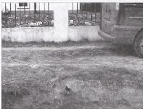
Wody opadowe z tej posesji podziemną rurą trafiają na ul. Przecznicza