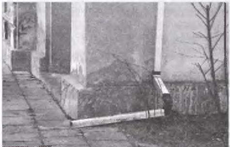
Podobny widok przy skrzyżowaniu ulic Poznańskiej i Rządowej