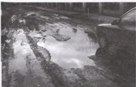
ul. Działkowa po roztopach

Gdy w pierwszej połowie lutego stopniały śniegi na wielu ulicach Puszczykowa pojawiła się czarna maź, utrudniająca poruszanie się samochodów, ale przede wszystkim – zwłaszcza, tam, gdzie jak przy ul. Cienistej, nie ma chodników – niemal uniemożliwiająca chodzenie.