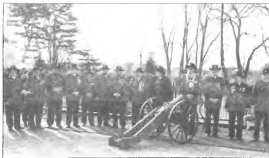
Obok kościoła w Mosinie

i regionu. Wymienię tu chociażby turnieje strzeleckie, które tradycyjnie organizujemy w święto Konstytucji 3 Maja, w Zielone Świątki - o godność króla kurkowego, 15 sierpnia w święto Wojska Polskiego i święto Niepodległości, a także po raz piąty w drugą niedzielę września o Memoriał Strzelecki Patrona Bractwa - imprezę o zasięgu ogólnopolskim. W ubiegłorocznym Memoriale wzięły udział delegacje z 27 miast z całej Polski.