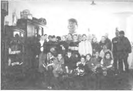
Młodzież w Muzeum „Kargula i Pawłak”

W drodze powrotnej ze smutkiem spoglądaliśmy na martwy las w Górach Izerskich, będący przykładem niszczącego wpływu przemysłu na środowisko.