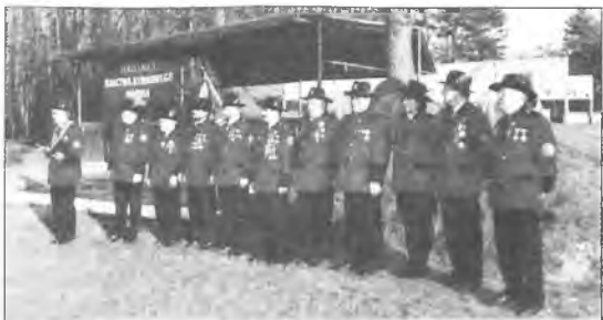
Turniej strzelecki w Ludwikowie

Uważny Czytelnik zwrócił już niewątpliwie uwagę, że autor tekstu raz pisze o bractwach strzeleckich, a następnym razem o bractwach kurkowych. Albowiem wszyscy jesteśmy strzelcami spod znaku kura. Strzelanie do sylwetki kura zawieszzonego na żerdzi lub maszcie jest najbardziej pasjonującą konkurencją strzelecką. Zwycięzcą zostaje ten strzelec, który ostatni strąci kura.