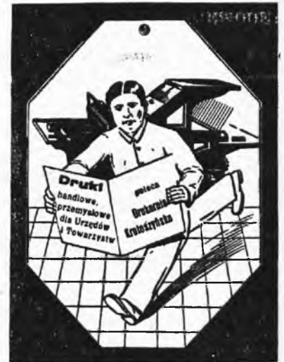
Dawn. Drukarnia K. K. O.