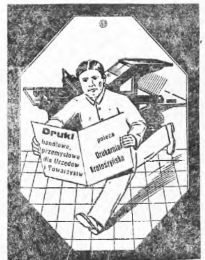
Dawn. Drukarnia K. K. O.