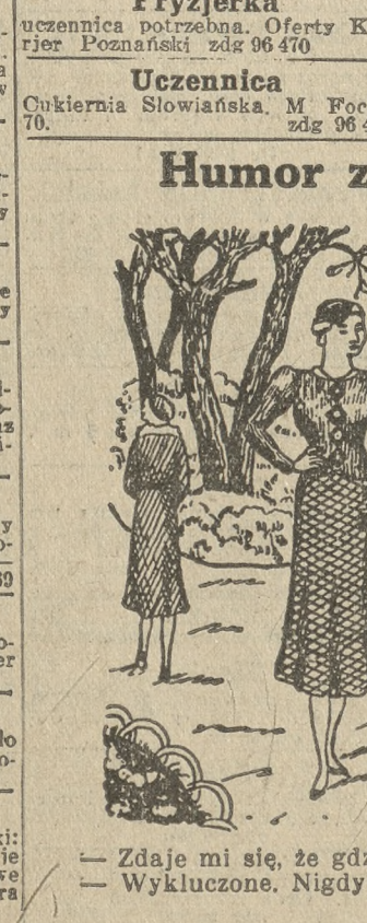
— Zdaje mi się, że gdzieś już panią poznałem? — Wykluczone. Nigdy nie chodzę do Zoologu. (Judge — N. Jork). S. F.

Przedpłata na miesiąc maj 1933 roku za oba wydania razem w Poznaniu w ekspedycji zł 2,20, w agencjach w mieście zł 3,50, z odnośnikiem do domu w Poznaniu zł 3,70, z odnośnikiem przez pocztę poza Poznaniem miesięcznie zł 4,14, kwartalnie zł 12,40, pod opaską miesięcznie w Polsce zł 7,50, w innych krajach zł 9,50. W razie wypadków spowodowanych siłą wyższą, przeszkód w zakładzie, strajków i t. p. wydawnictwo nie odpowiada za dostarczenie pisma, a abonent nie ma prawa domagania się niedostarczonych numerów lub odszkodowania.