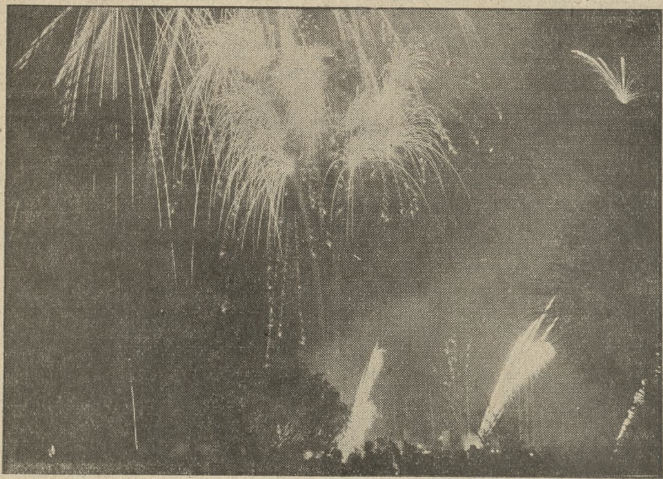
Na lazurowym brzegu w Cannes urządzono festyn na powitanie wiosny, podczas którego spalono bajkowe wprost ognie sztuczne.

Wąsy mają w Anglii to samo znaczenie, co srebrne epolety na ramionach lub ostrogi przy butach. Rzecz prosta, że nosząc się po cywilnemu, angielski oficer wchodzi do towarzystwa bez ostróg brzęczących i bez epoletów. Dlatego też twarze przez wąsy muszą być ujednoliconie. Nie brak jednak między Anglikami „duchów przekory”, którzy buntują się przeciw uniformowaniu twarzy i nie chcą nosić wąsów.