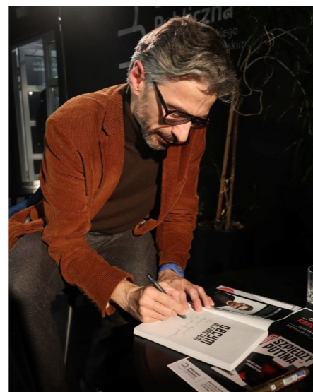
fol. MiPBP Nowy Tomyśl

poczytnych reportaży, w tym między innymi Obcym alfabetem. Jak ludzie Kremla i PiS zagrali podłuchami czy Szpiedzy Putina. Jak ludzie Kremla opanują Polskę , która stała się jednym z głównych tematów naszego spotkania.