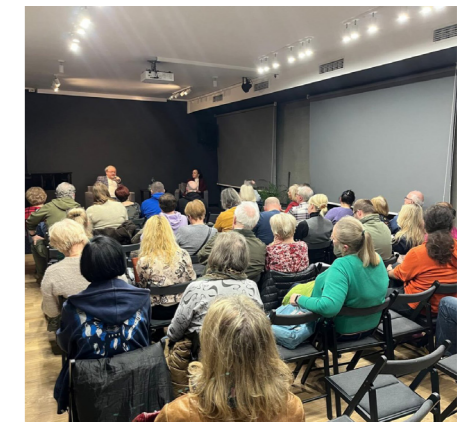
fol. BM Lubon