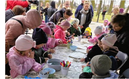
fol. GBP Wierzbinek

Park w Wierzbinku zamienił się w miejsce pełne śmiechu, zabawy i prawdziwie wielkanocnej atmosfery. Wszystko za sprawą pierwszej edycji wielkanocnego poszukiwania jajek, która przyciągnęła tłumy najmłodszych mieszkańców gminy wraz z ich rodzicami. Wydarzenie okazało się ogromnym sukcesem i już teraz zapowiada się jako nowa, lokalna tradycja.