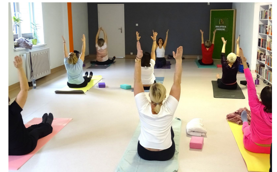
fol. BPG Grodziec