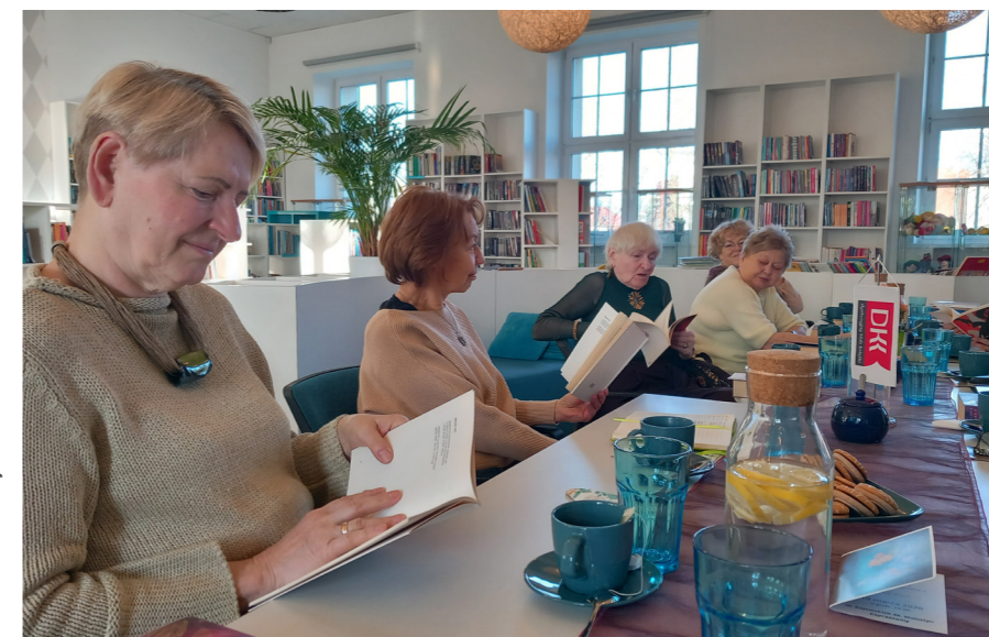
fol. BPMiG Wolsztyn

Biblioteka Publiczna Miasta i Gminy Wolsztyn im. Stanisława Platęra