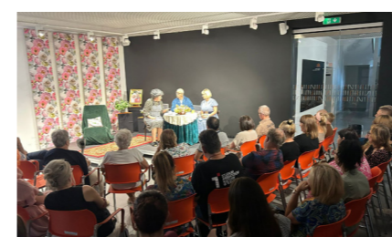
fol. BP Ostrów Wielkopolski

Współczesna kultura, także ta dostępna w bibliotekach, coraz silnie opiera się na komunikatach wizualnych – obrazach, filmach, grafikach czy przekazach scenicznych. W tym kontekście szczególnego znaczenia nabiera