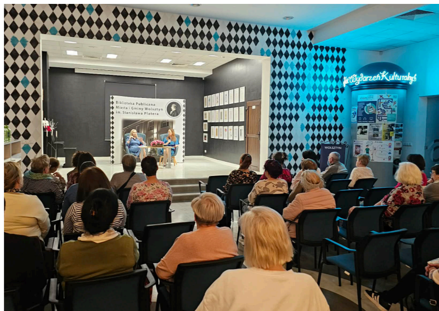
fol. BPMiG Wolsztyn

Biblioteka Publiczna Miasta i Gminy Wolsztyn im. Stanisława Platera