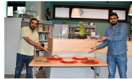
fol. MIPBP Nowy Tomyśl

Wcześniejsze spotkania z udziałem gości m.in. z Argentyny, Kolumbii, Nigerii, Wietnamu czy Meksyku pokazują, jak duże znaczenie ma ten cykl dla lokalnej społeczności. Każde kolejne