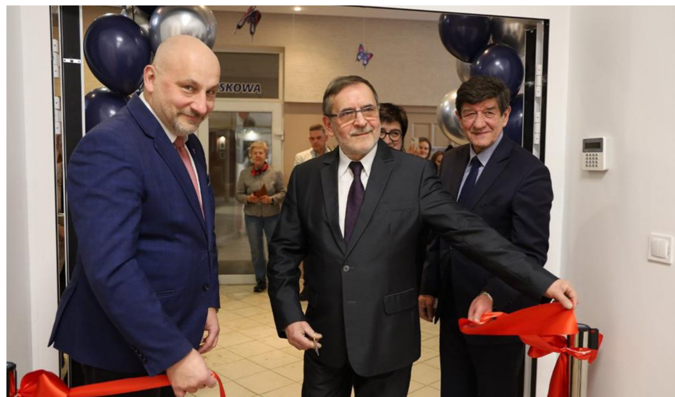
fol. Grodziska BP