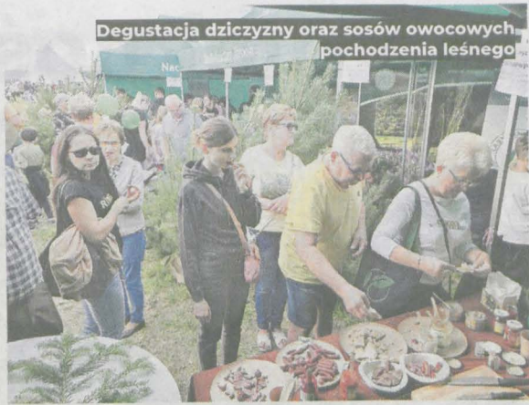
Degustacja dziczyzny oraz sosów owocowych pochodzenia leśnego