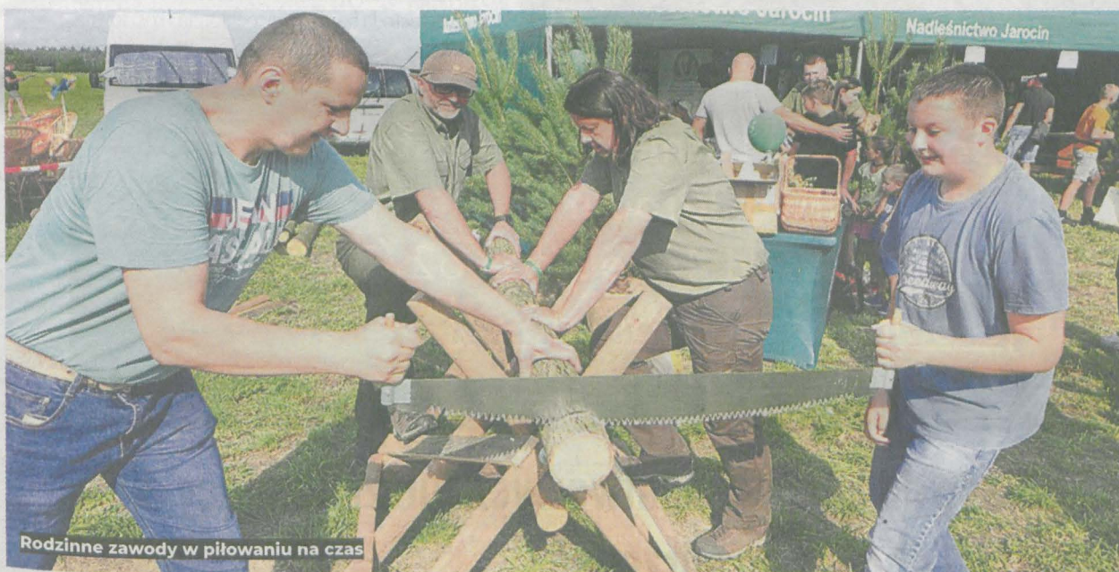
Rodzinne zawody w piłowaniu na czas