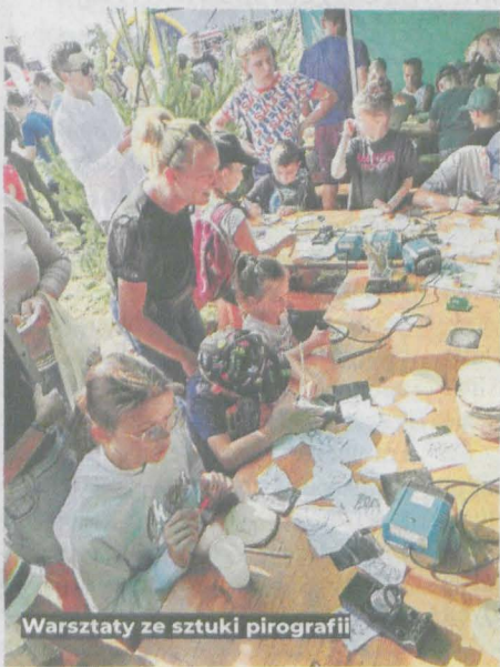
Warsztaty ze sztuki pirografii