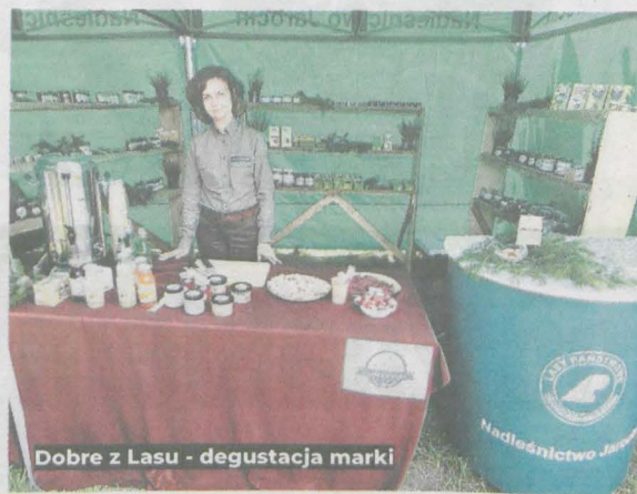
Dobre z Lasu - degustacja marki