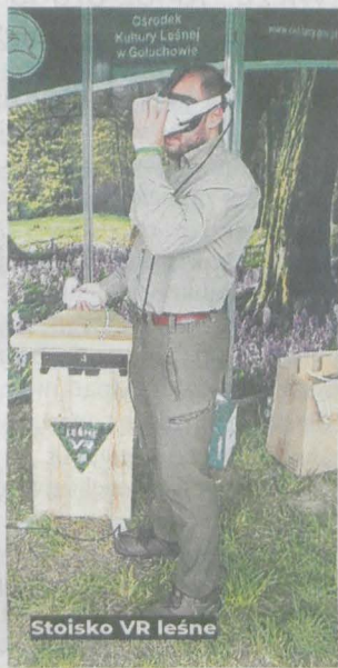
Stoisko VR leśne