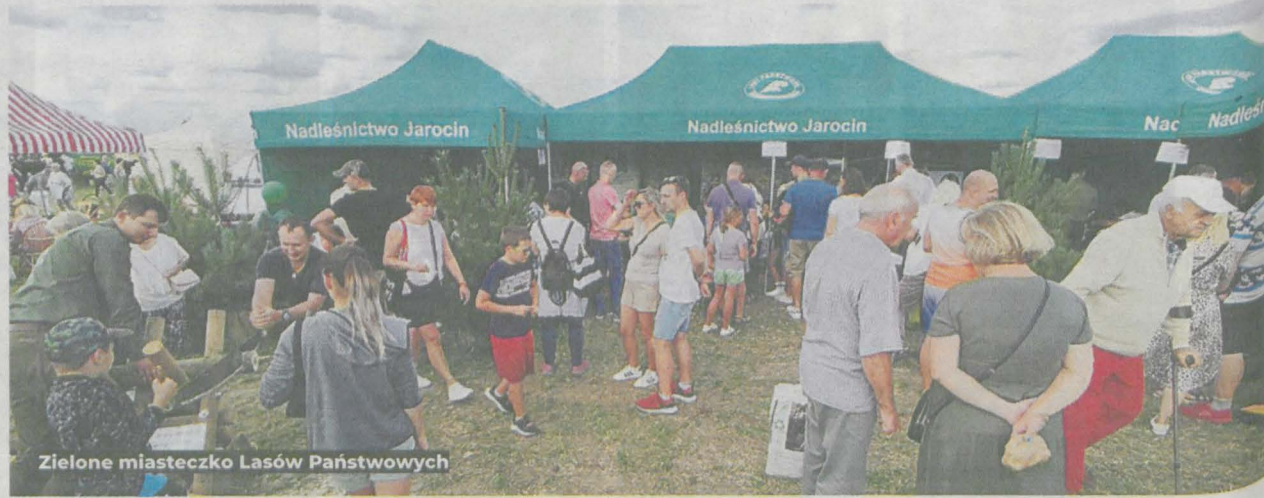
Zielone miasteczko Lasów Państwowych