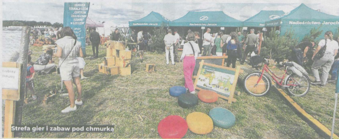
Strefa gier i zabaw pod chmurką