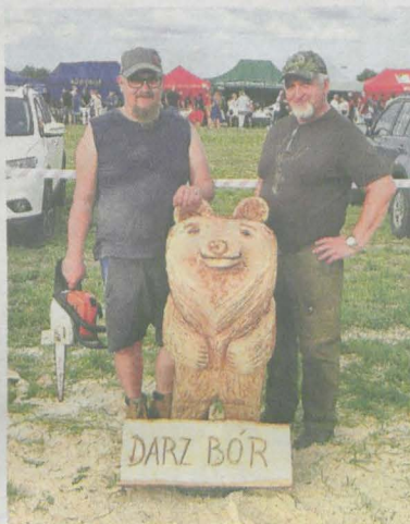
Lipa zamieniła się w sympatycznego misia. Z autorami pracy