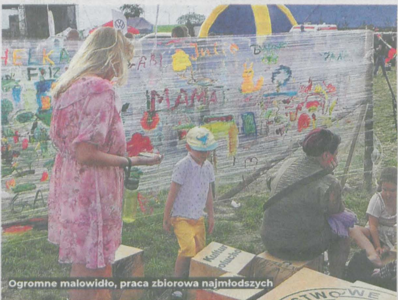
Ogromne malowidło, praca zbiorowa najmłodszych

W dniach 2-3 września w Jarocinie przy ul. Maratońskiej odbył się Wielkopolski Hubertus połączony z Jarocińskim Festiwalem Kultury Łowieckiej. Na imprezie nie mogło zabraknąć stoisk Lasów Państwowych.