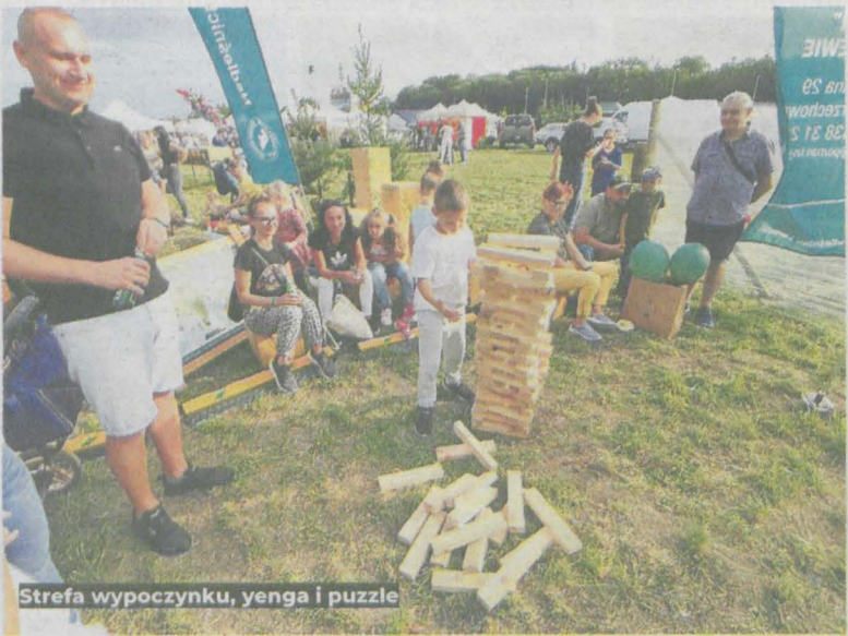
Strefa wypoczynku, yenga i puzzle

Były pokazy - psów myśliwskich, kaskaderskie, jazdy konnej, łucznictwa, mody myśliwskiej z lat 20-tych XX wieku, loty widokowe balonem i helikopterem, występy wokalne i teatralne. Imprezie - w ramach Święta Darów Natury w Jarocinie - towarzyszyła też wystawa maszyn rolniczych, jarmark produktów regionalnych oraz rękodzieła. Wieczór z kolei upłynął pod znakiem muzycznych atrakcji.