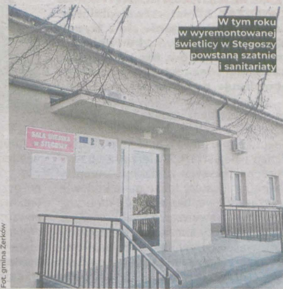
W tym roku w wyremontowanej świetlicy w Stęgoszy powstaną szatnie i sanitariaty