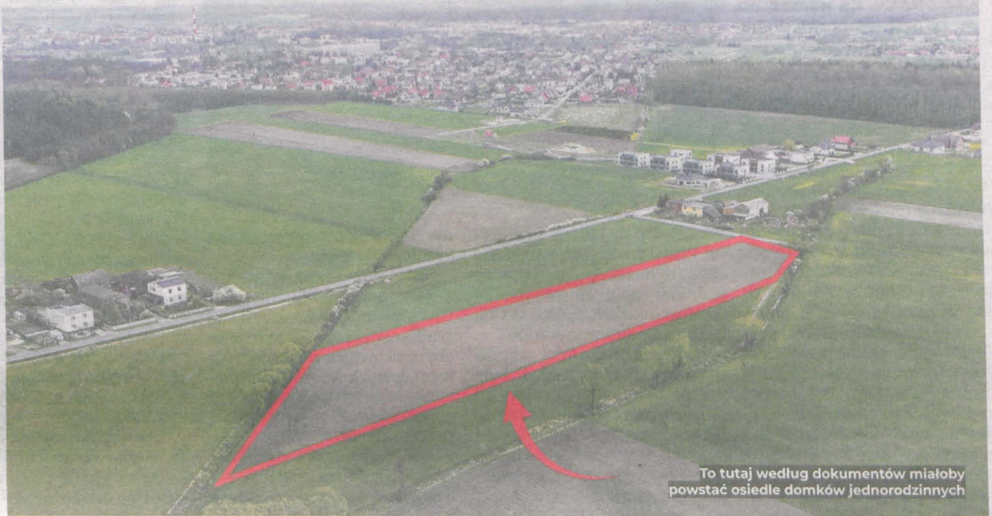
To tutaj według dokumentów miałyby powstać osiedle domków jednorodzinnych

mistrz Jarocina wszczął postępowanie w sprawie wydania decyzji o środowiskowych uwarunkowaniach dla budowy 27 domów jednorodzinnych wraz z drogą wewnętrzną w Roszkowie.