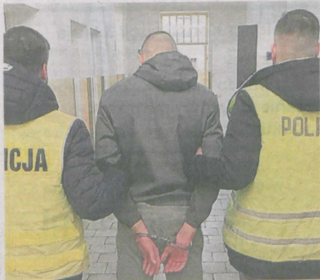
Zdjęcie poglądowe