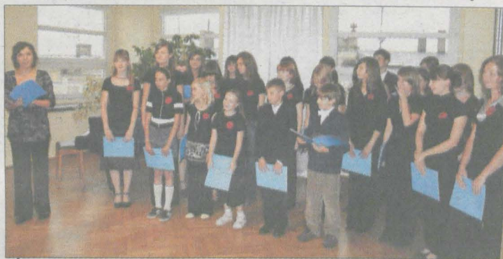
Śpiewanie daje radość - udowodnił chór Ama la Musica.

Pierwsze dźwięki zaśpiewali jeszcze bardzo drżącymi z emocji i tremy głosami. Później było coraz lepiej, a debiut chóru Ama la Musica przy Miejskiej Bibliotece Publicznej uznać można za udany.