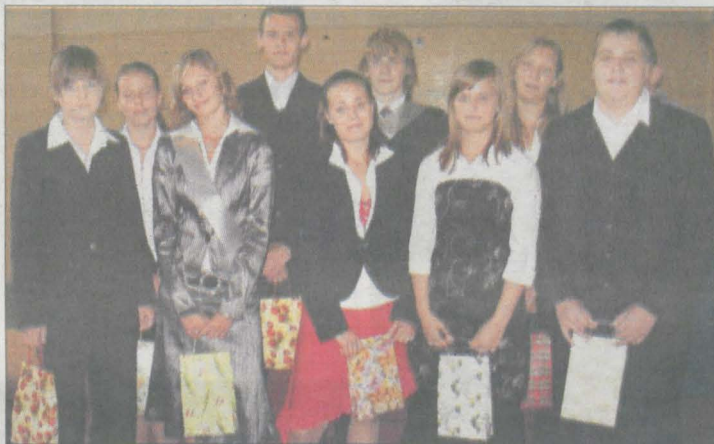
Laureaci Gimnazjonów 2007 z Zespołu Szkół Rolniczych.

Ponad godzinę trwało zakończenie roku szkolnego w Zespole Szkół Rolniczych w Środzie. Były kwiaty dla nauczycieli, nagrody dla najlepszych uczniów. Były także specjalne wyróżnienia od gimnazjalistów dla ich nauczycieli i kolegów.