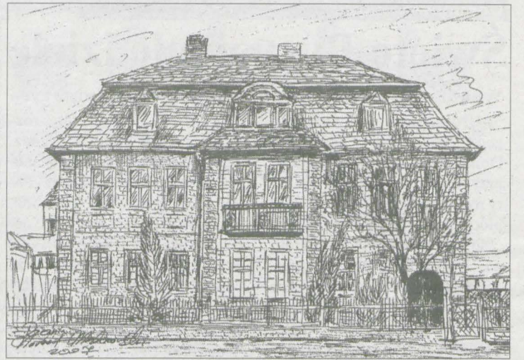
Rzeźnia powstała w 1915 roku. Co będzie w przyszłości z zabudowaniami przy ul. Kilińskiego? Ciągłe nie wiadomo.