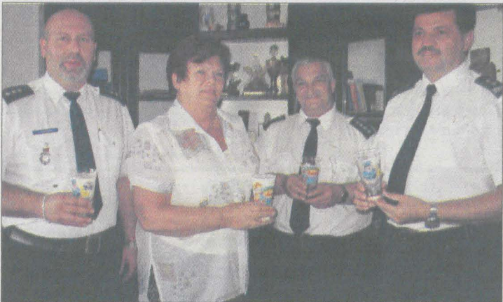
Organizatorzy akcji prezentują wyjątkową szklankę do mleka, na której widnieją podobizny Zuzi i Pyrka

Od przyszłego tygodnia zapraszamy wszystkie dzieci do wspólnej wakacyjnej zabawy z Zuzią i Pyrkiem. Warto będzie trochę pomysleć. W nagrodę zwycięzca co tydzień otrzyma atrakcyjną nagrodę.