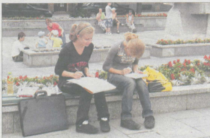
Najciekawsze prace powstały w sobotę na Starym Rynku.

Kolegiata oraz kamieniczki na Starym Rynku były głównymi „modelkami” młodych artystów, którzy w sobotę wzięli udział w drugim etapie Ogólnopolskiego Konkursu Plastycznego „Piękna nasza Polska cała”.