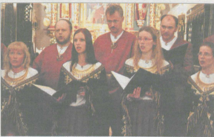
Koncert w kolegiacie