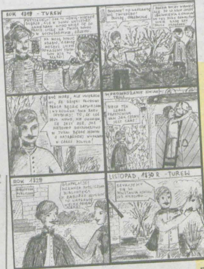
Fragment komiksu średzianki.

manistycznym. Do udziału w konkursie namówiła ją nauczy-