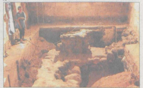
Tak wyglądały wykopiska wewnątrz kościoła.