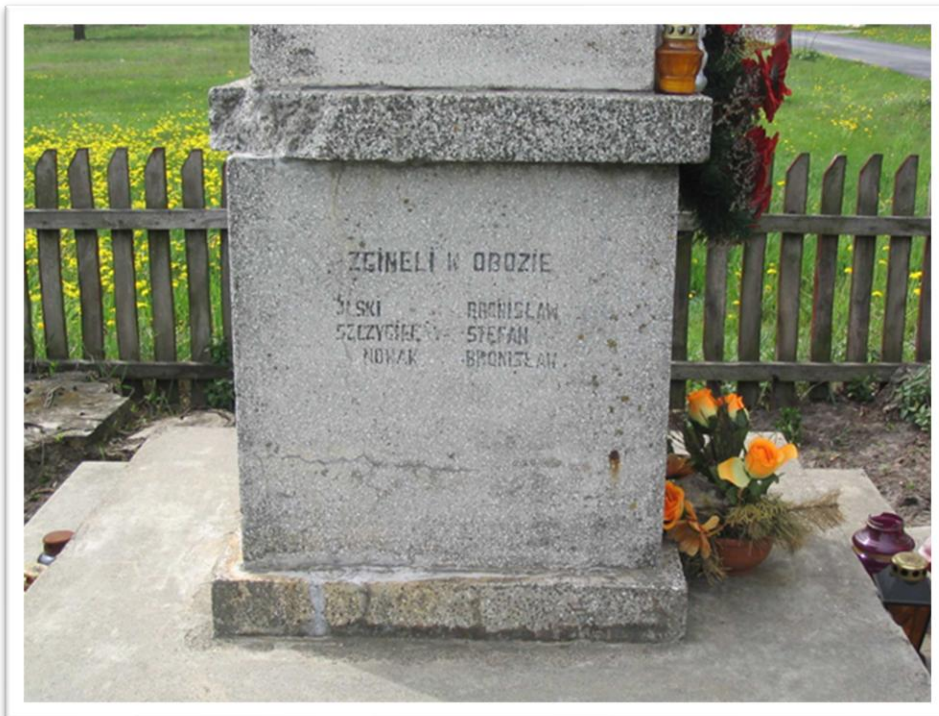
Przed i po renowacji