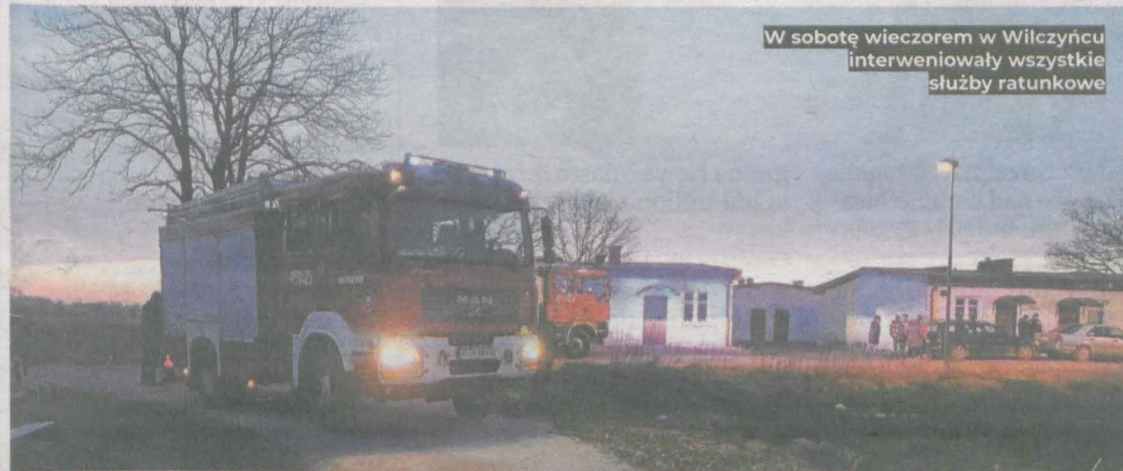
W sobotę wieczorem w Wilczyńcu interweniowały wszystkie służby ratunkowe