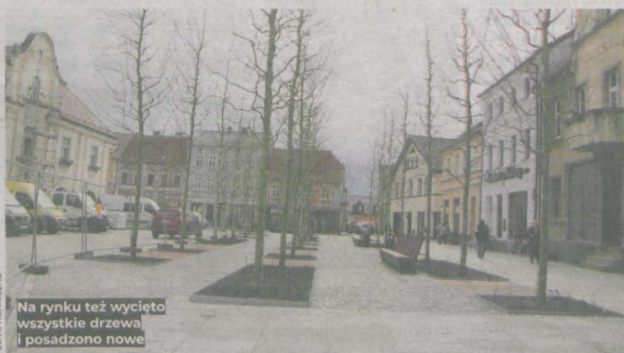
Na rynku też wycięto wszystkie drzewa i posadzono nowe