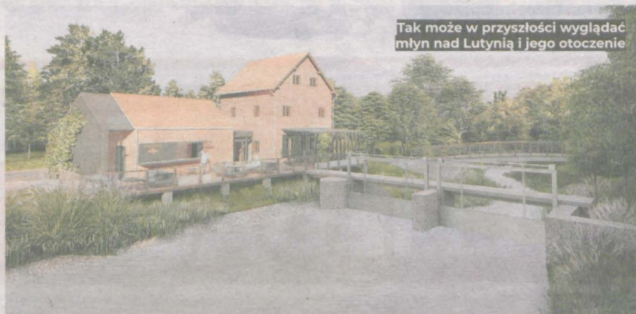
Tak może w przyszłości wyglądać młyn nad Lutynią i jego otoczenie