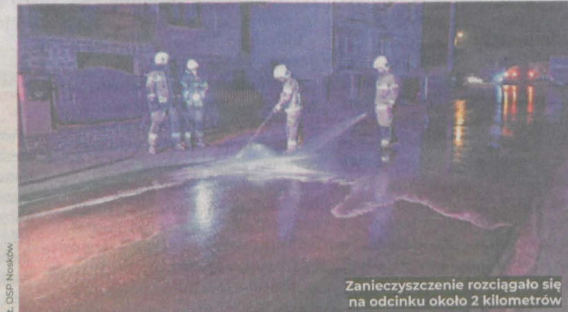
Zanieczyszczenie rozciągało się na odcinku około 2 kilometrów

Mieszkaniec gminy Jaraczewo potwierdził, że przewoził odpady. Za zabrudzenie drogi został ukarany mandatem w wysokości 200 zł.