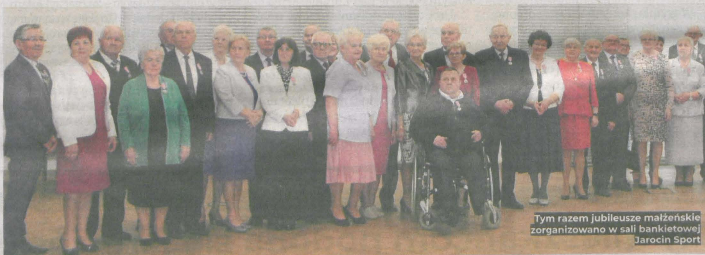
Tym razem jubileusze małżeńskie zorganizowano w sali bankietowej Jarocin Sport

Polskiego Związku Wędkarskiego wraz z małżonkami.