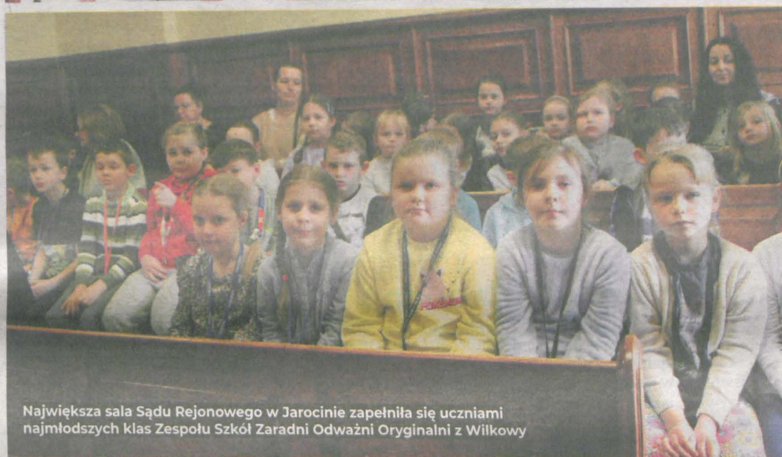
Największa sala Sądu Rejonowego w Jarocinie wypełniła się uczniami najmłodszych klas Zespołu Szkół Zaradni Odważni Oryginalni z Wilkowyi

niu. Twierdził, że ludzie boją się Wilków i dlatego oskarżają je o różne rzeczy. Utrzymywał, że chciał tylko spróbować smakołyków z koszyka Czerwonego Kapturka, ale nie jada ludzi.