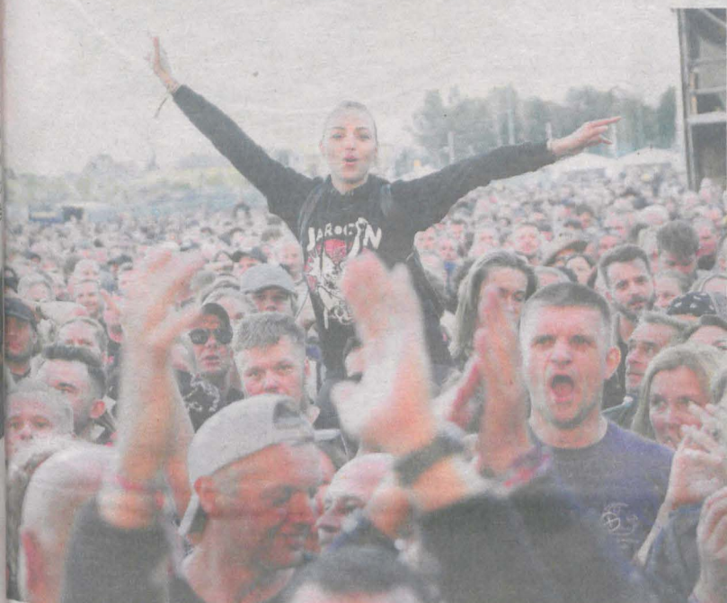
Jarocin Festiwal 2022