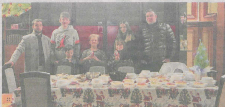
W miłej atmosferze wszyscy składali sobie życzenia. Raczone się też wigilijnymi przysmakami