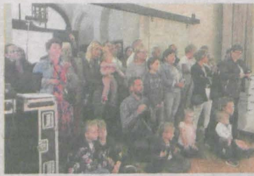
Hip-hop na ludowo? To możliwe. „Letnia akademia ludowo-rockowa” czyli Kiedy Wieś spotyka Miasto była spotkaniem twórców muzyki ludowej z artystami hip-hopowymi. Zwieńczeniem warsztatów był koncert