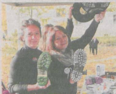
Podczas plenerowej imprezy przy Skarbczyku odbyły się warsztaty z kuglarstwa, ozdabianie płyt winylowych odciskiem podeszwy glana. Robiono też na miejscu przypinki z motywem kultowego buta

Uczestnicy, wspólnie zorganizowali też wyjątkowe wydarzenie „Glanomania”.