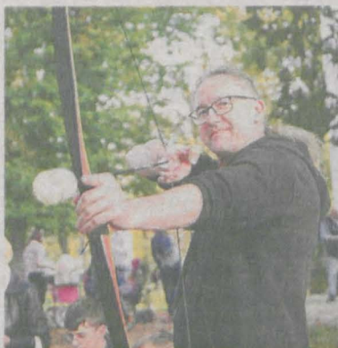
Można było również postrzelać z łuku, złowić glana na wędkę, bądź też sprawdzić się kręcąc hula hop