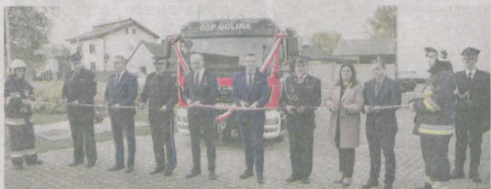
Przekazanie samochodu ratowniczo-gaśniczego dla OSP w Golinie