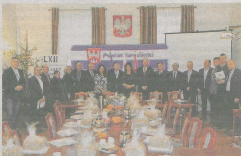
Władze powiatu spotkały się z dyrektorami podległych jednostek i z przedstawicielami służb mundurowych.

Spotkanie było okazją do podsumowań mijającego roku i omówienia przyszłorocznych zamierzeń, a także do podziękowań i składania życzeń – Spotykacie się państwo z różnymi sy-