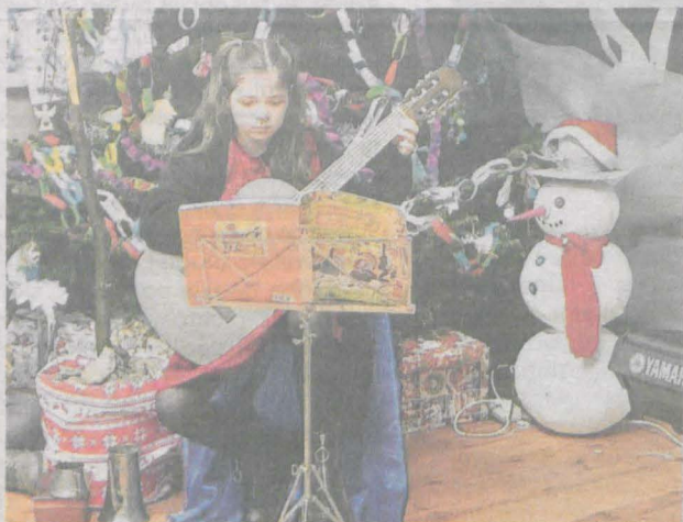
Najmłodszy zaśpiewali koledy