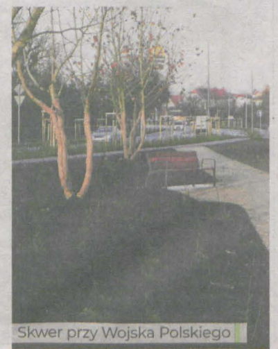
Skwer przy Wojska Polskiego