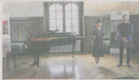
JAROWIND to Regionalny Przegląd Instrumentów Dętych Drewnianych. Zorganizowały go dwie instytucje: Muzeum Regionalne w Jarocinie i Państwowa Szkoła Muzyczna I Stopnia w Jarocinie

W tym roku odbyło się kilka działań w zakresie poszanowania tradycji. Ich celem było nie tylko poznanie historii i dziedzictwa kulturowego, ale też współpraca i wymiana międzypokoleniowa.