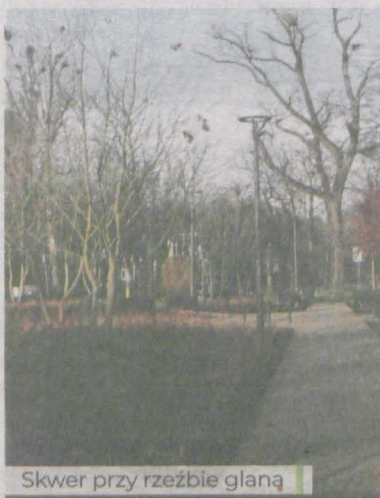
Skwer przy rzeźbie glana