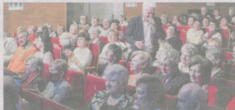
Koncert z okazji Dnia Kobiet: „O kobietach prawie wszystko” - pod takim tytułem odbył się koncert z okazji Dnia Kobiet. Było to jednocześnie pierwsze wydarzenie w ramach przedsięwzięcia „Aktywizacja kulturalna seniorów w ramach „CUS”

400 osób mogło skorzystać z rehabilitacji i zajęć zdrowotnych. Gmina Jarocin pozyskała na ten cel ponad 3 mln złotych dotacji z Europejskiego Funduszu Społecznego. Dobra wiadomość jest taka, że w tym roku działania się nie kończą. Projekt będzie kontynuowany do września 2023 roku. Zobaczcie, co działa się do tej pory.