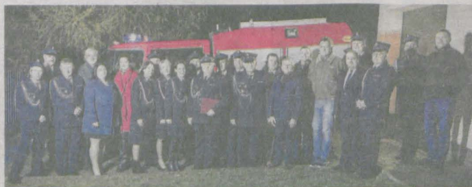
Przekazanie wozu bojowego dla OSP w Kadziaku