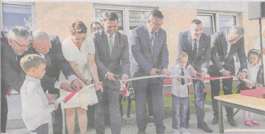
Otwarcie przedszkola w Witaszycach