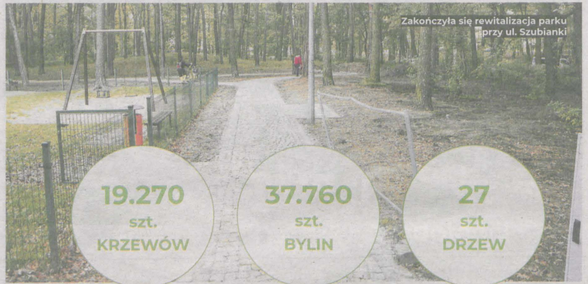
Zakończyła się rewitalizacja parku przy ul. Szubianki

Na realizację tego działania gmina otrzymała ponad 12 mln zł unijnej dotacji. Pieniądze pozwoliły na rewitalizację wszystkich trzech parków oraz stworzenie zielonych korytarzy roślinnych, które je łączą. Powstało też 5 zielonych skwerów z ławeczkami. Jarocin stał się zielonym miastem.