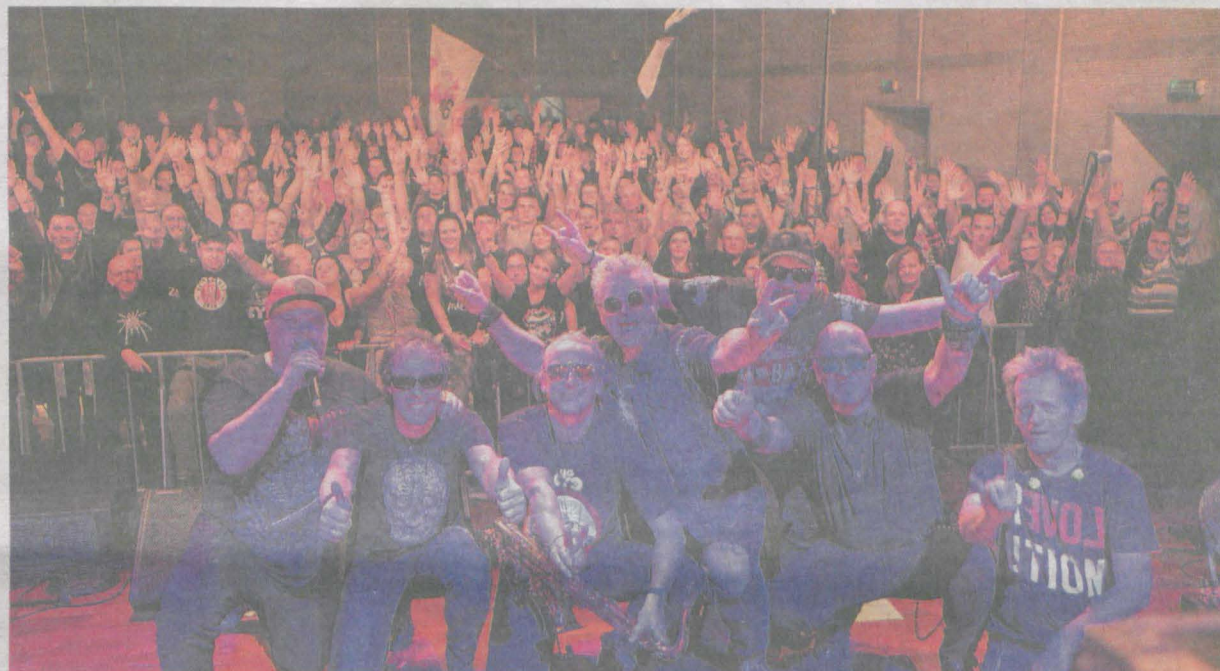
Koncert zespołu Big Cyc