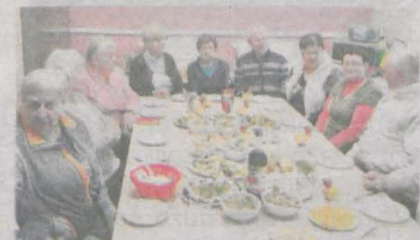
Warsztaty kulinarne. Odbywały się w różnych miejscach. Na zdjęciu zajęcia w Golinie