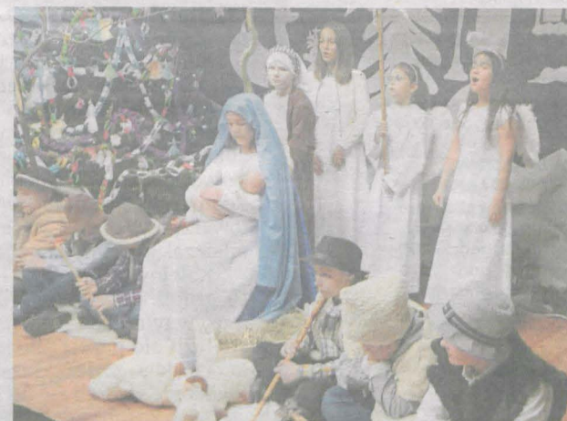
Uczniowie ze szkoły w Woli Książęcej wystąpili w świątecznym przedstawieniu