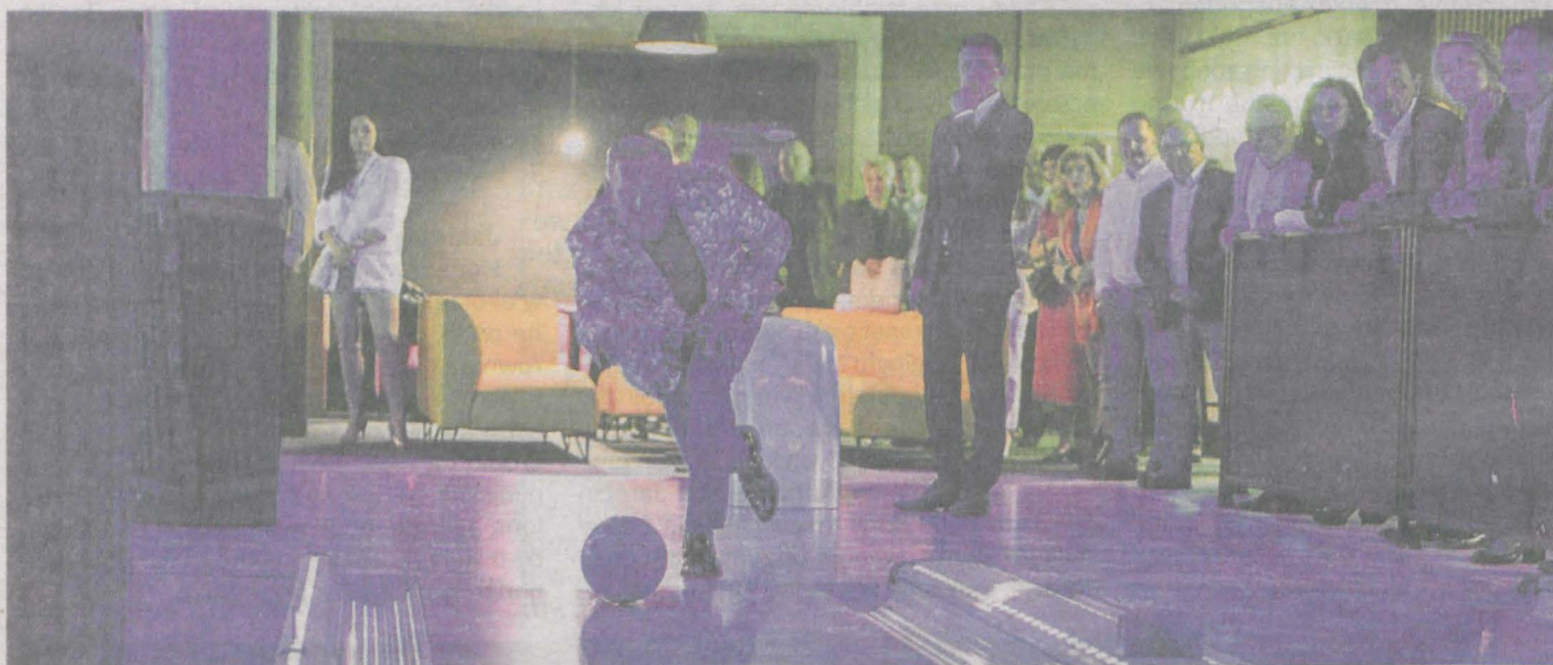
Green Room z kręgielnią o światowym standardzie, dysponującą sześcioma torami do gry. Obok kręgielni powstały nowoczesne sale klubowe