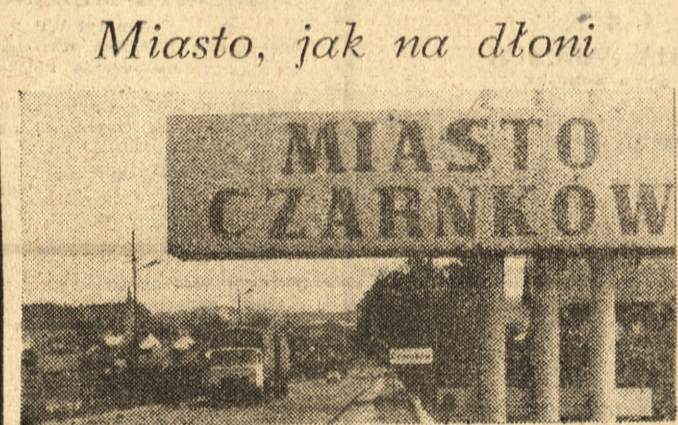
Wjeżdżając do Czarnkowa (Pilskie) od strony Wałcza kierowcy widzą panoramę miasta jak na dłoni.

tyzana” (chiń), „Wrostki” (radz.), „Tankowiec w płomieniach” (radz.), Syrena: „Walka o ogień” (kanad.), „Imperium kontratakuje” (amer.).