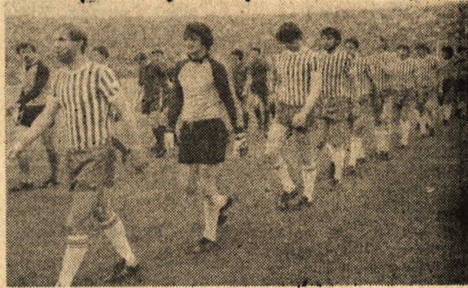
Piłkarze Lecha (w pasiastych koszulkach) wkraczają na murawę stadionu przed decydującym o tytule mistrza Polski meczem z Pogonią.