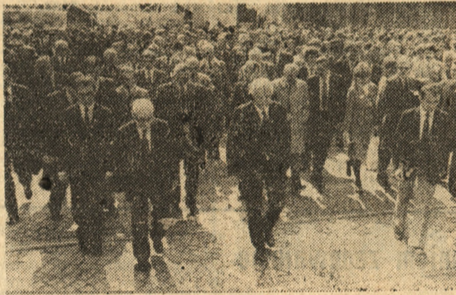
Na zdjęciu: podczas otwarcia targów poznańskich.

Gości w imieniu władz miasta powitał i życzył im udanej gościnności w Poznaniu i owoc-