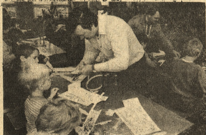
Na zdjęciu: klejenie modeli samolotów jest interesujące.

W minioną sobotę do Nowego Tomysła przyjechały dzieci z Borui Kościelnej, Bukowca, Jastrzębska. Razem ze swoimi rówieśnikami z Nowego Tomysła wzięły udział w imprezie „Sobota inaczej”. Pomysł wypełnienia wolnego od nauk sobotniego dnia atrakcyjnymi imprezami kulturalnymi i sportowymi w gminach powstał na początku roku szkolnego w Kuratorium Oświaty i Wychowania w Po-