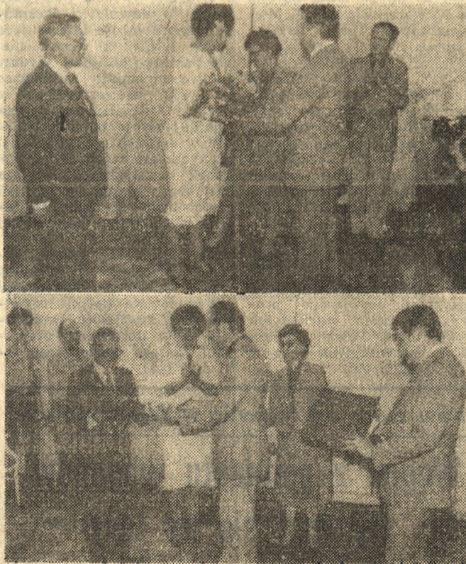
Na zdjęciu: podczas wręczenia nagród dziennikarskich im. Marcina Kasprzaka.

W czasie spotkania z koncertem muzyki renesansowej wystąpił zespół Collegium Musicorum Poznaniensium. (bran)