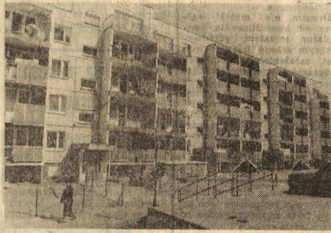
Jednym z wyróżnionych w tym roku budynków jest obiekt postawiony przez Kombinat Budowlany Poznań-Wschód na Osiedlu ZWM 23—28 w Poznaniu.