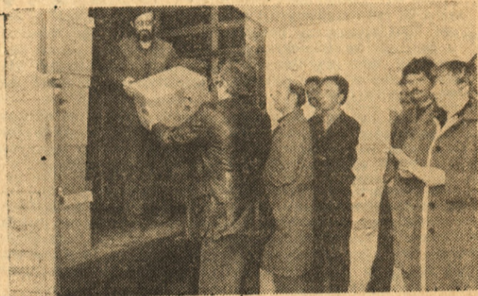
Rozładowywanie darów berlińskich lekarzy.