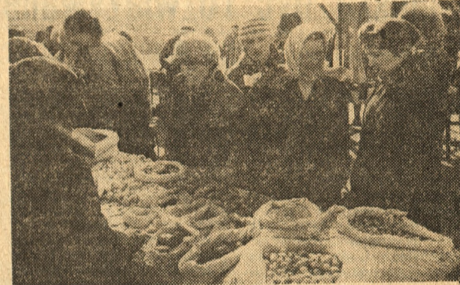
Duży ruch panuje obecnie w sklepach ogrodniczych i przy straganach na targowiskach. Działkowcy poszukują nasion, narzędzi i środków chemicznych potrzebnych do wiosennych prac. Na zdjęciu: przy straganie na targowisku w Lesznie.