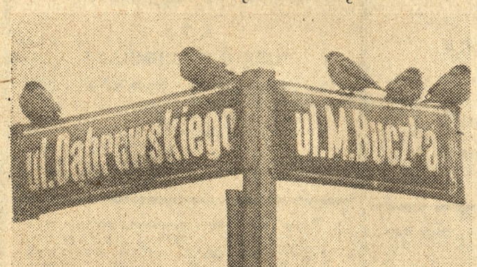
Tak oto obrazek uwleczył na kliszy nasz fotoreporter w Wałcu (Piłskie).