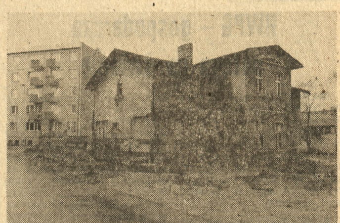
W Lesznie przy ul. 17 Stycznia trwa remont domu, który będzie siedzibą Zarządu Wojewódzkiego ZSMP.