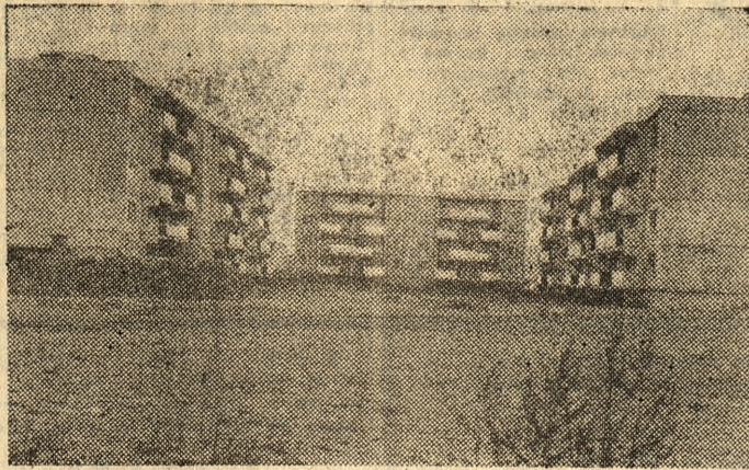
Tak wygląda fragment najnowszego osiedla mieszkaniowego Leszno — „Przylesia”.