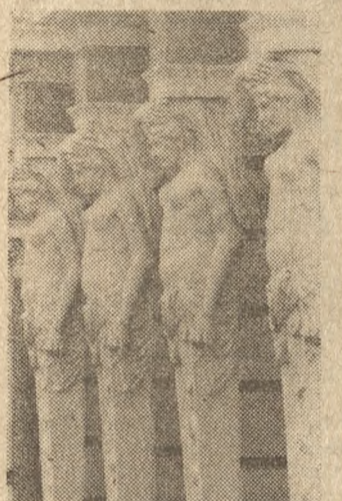
Dzisiaj, w świątecznym nastrój, dajemy wam do ręki dziewczynę jak skały.