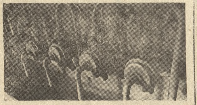
Fot (2) — R. Królik