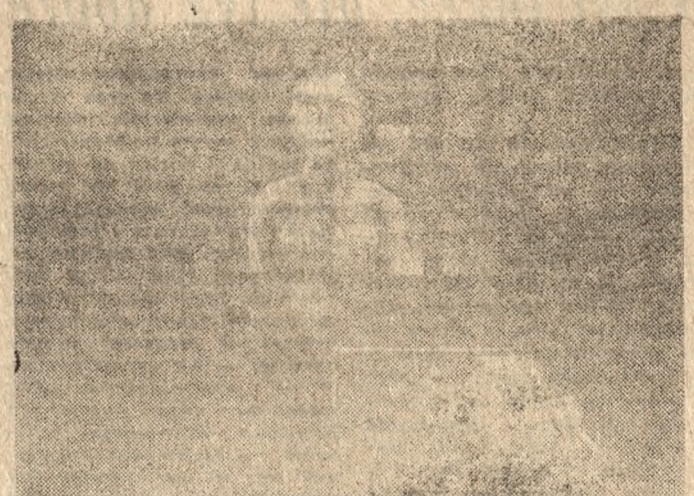
„Niedziela rano”, olej, 1981.