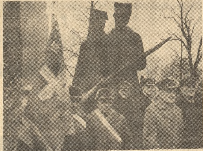
Byli uczestnicy Powstania Wielkopolskiego przed pomnikiem wzniesionym ku upamiętnieniu ich bohaterskich czynów.

czyli się sukcesem globalnym. Chcę wam serdecznie podziękować — mówił dalej E. Łukasik — za pracę polityczno-patriotyczną, która mimo wazszego sędziwego wieku jeszcze prowadzicie, przekazując młodzieży najlepsze tradycje naszego narodu. Prezes ZW ZBoWiD — Ma-