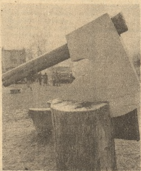
Groźnie wygląda topór w centrum Krajenki (Pilskie), ale jest to tylko symbol tego miasteczka.