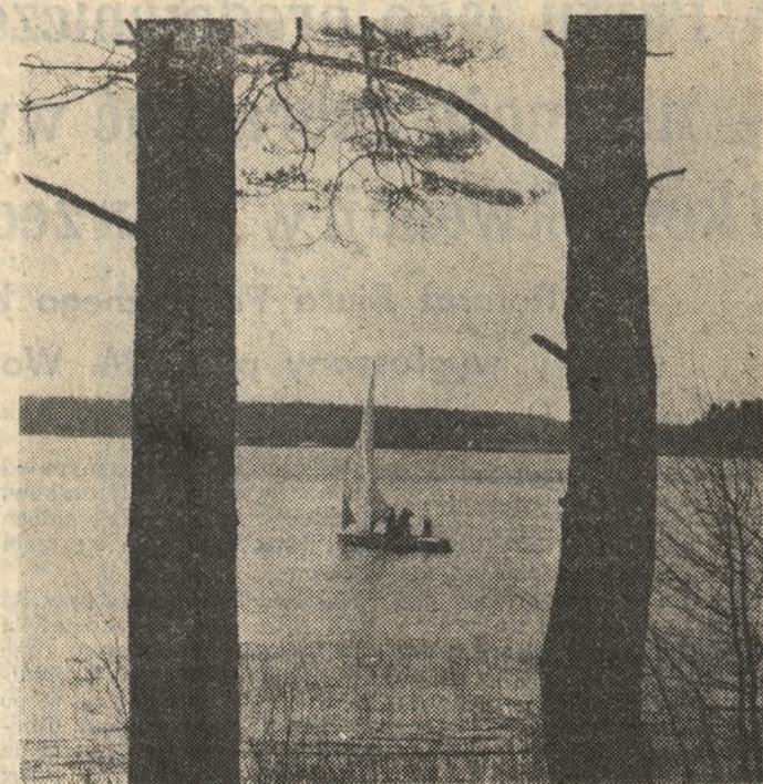
Żeglarze z niecierpliwością oczekiwali nadejścia wiosny. Pogoda na razie im sprzyja, nie skąpi wiatru. Pejzaż mazurskich jezior (na zdjęciu) malowniczo uzupełniają teraz żagla.