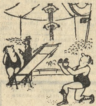
Ostrożnie, w minionym tygodniu dwóch partnerów nie wróciło! („Pourquoi Pas“)