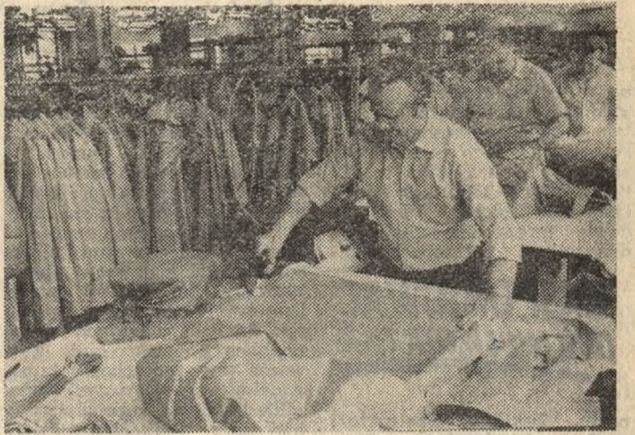
Końcowy etap produkcji jednego z wielu wyrobów „Cory” — prasowanie płaszczy.