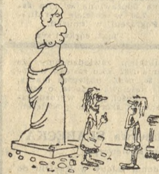
Nie wiem, jak to uzyskali inni, ja po prostu nie umiem rzeźbić rąk. („Riveli“)