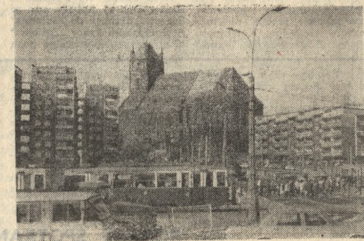
Fragment odbudowanej ze zniszczonej wojennych szczecińskiej Starówki.

Kiedy w ten pamiętny poniedziałek nieliczna grupka Polaków zagospodarowywała się w Szczecinie, nawiązując pierwsze kontakty robocze z radzieckim komendantem wojennym miasta i zabezpieczając na potrzeby tworzących się władz polskich gmachy u-