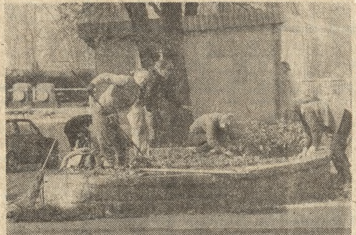
Tradycyjne porządki wiosenne objęły wiele miejsc w Lesznie. Ma być czysto, a dzięki zieleniom — kolorowo. Czy będzie — niebawem zobaczymy.