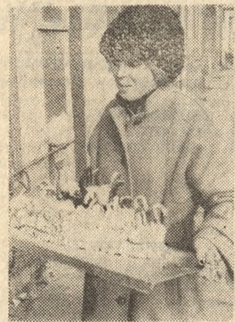
Trzeba nie lada cukierniczego kunsztu, by w tak misterny i efektywny sposób ozdobić tort. Przpomina prawie... jezioro lądzkie.