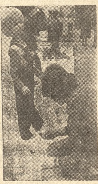
Por. „Głor” — R. Królik

wym miejscu w kraju. W ubiegłym sezonie plantatorzy osiągnęli rekordowe zbiory buraków, nieznacznie przewyższające 400 kwintali z hektara. Największy wydatek cukru uzyskali, niemal już tradycyjnie, cukrownia w Górze. Wszystkie cukrownie leszczyńskie, odbierające także surowiec z województwa górzowskiego, wyprodukowały w tym roku prawie 25 000 ton cukru więcej niż w ubiegłej kampanii. (zd)