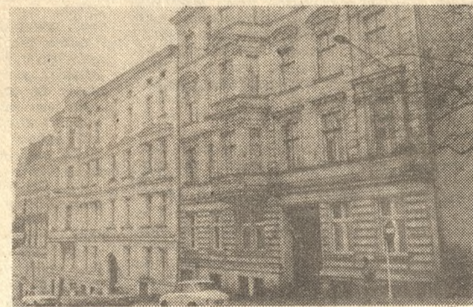
Domy przy ulicy Ogrodowej.