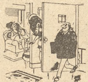
— Pan już przyszedł? A pani wciąż z panem rozmawia przez telefon. („Rise“)