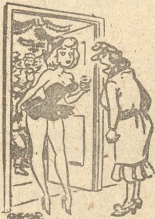
— Mąż godzinę temu zszedł do pani, żeby się poskarżyć na zbyt głośne zachowanie. („Daily Mirror“)