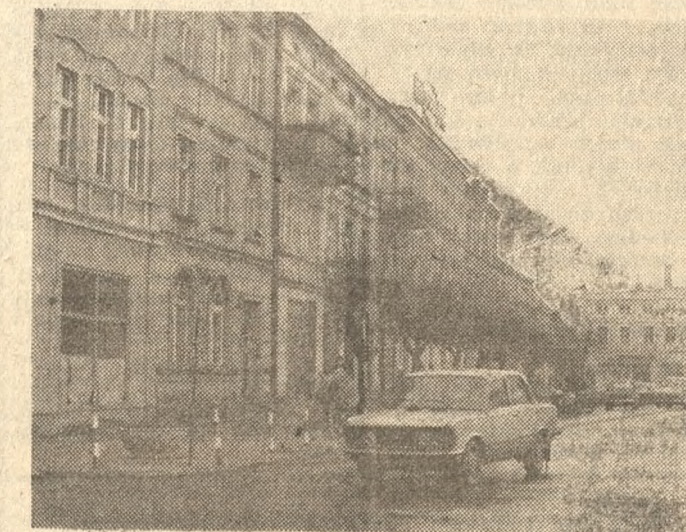
Fragment centrum Kępna.

Przyjeźdźcy zastanie tu waskie uliczki, a przy nich parterowe czy piętrowe zaledwie budynki, a także obowiązkowy rynek z ratuszem pośrodku. Kępno wyróżnia się jednak dworcem kolejowym, zaliczanym do jednego z nielicznych w kraju dworców dwupoziomowych. Wybudowano go bo w 1875 roku w miejscu, gdzie krzyżowały się pod kątem prostym dwie linie kolejowe, należące wówczas do różnych spółek.