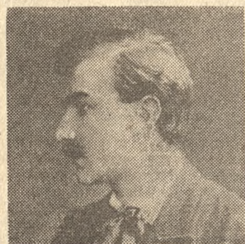
Jedno z młodzieńczych zajęć Karola Szymanowskiego

czewskiego... Serdeczne kontakty łączyły Szymanowskiego z plejadą innych wielkości pierwszej połowy naszego stulecia np. z Igiem Strawińskim, Maurycym Ravelem, Ignacym J. Paderewskim, czy „naszymi” — Zofią Nałkowską, Julianem Tuwimem, Stefanem Żeromskim. Bliskie więzi z tymi i innymi przyjaciółmi umożliwiały twórcy „Harnasi” te liczne wyjazdy zagranicę (bo na dostatek pieniędzy nigdy nie narzekał) — przede wszystkim artystyczne, a później i lecznicze.