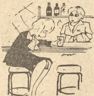
— Mąż rzucił mnie dla innej, a ona odesłała mi go z pocztówką. („Weltwoche“)