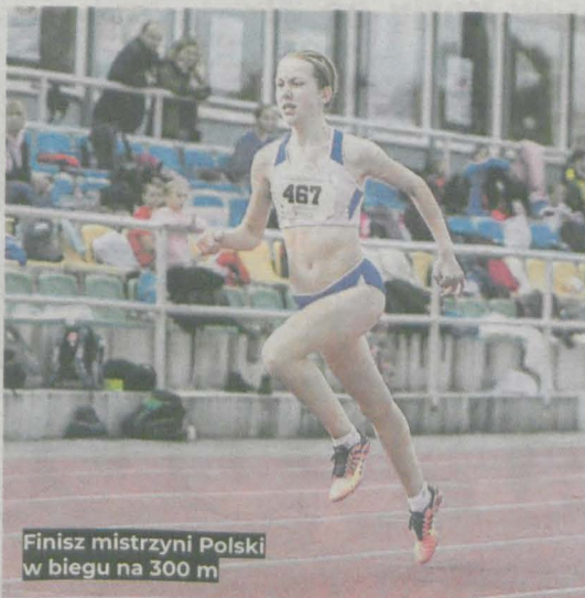
Finisz mistrzyni Polski w biegu na 300 m