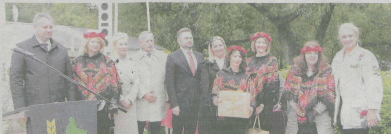
Podczas targów Agromarsz w Marszewie cztery przedstawicielki KGW Witaszyczki odebrały nagrodę za najpiękniejsze stroje

Kino sferyczne, jako niekonwencjonalna forma kształcenia, może przyjechać do każdej placówki edukacyjnej i nie tylko. Seanse edukacyjne odbywają się w nadmuchiwanym kopule o średnicy 5 metrów i wysokości 2,7 metra. Podczas seansu uczestnicy siedzą lub leżą na miękkich matach. Jeden pokaz trwa od 30 do 45 min (wstęp, film, zakończenie). W kopule mieści się - w zależności od wieku - od 20 do 35 osób.