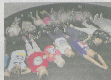
Niesamowite doznania w kinie, które przyjechało do przedszkola w Mieszkowie

Rok Romantyzmu w Muzeum Adama Mickiewicza w Śmiełowie wciąż trwa. Do tej pory można było uczestniczyć w koncertach, wykładach czy nawet pokazach mody, ale to jeszcze nie koniec. Muzeum w Śmiełowie przygotowało kolejną ciekawą propozycję. W sobotę 15 października o godz. 17:00 rozpocznie się spotkanie autorskie Andrzeja Seweryna „Mój brat Adam”. (BB)