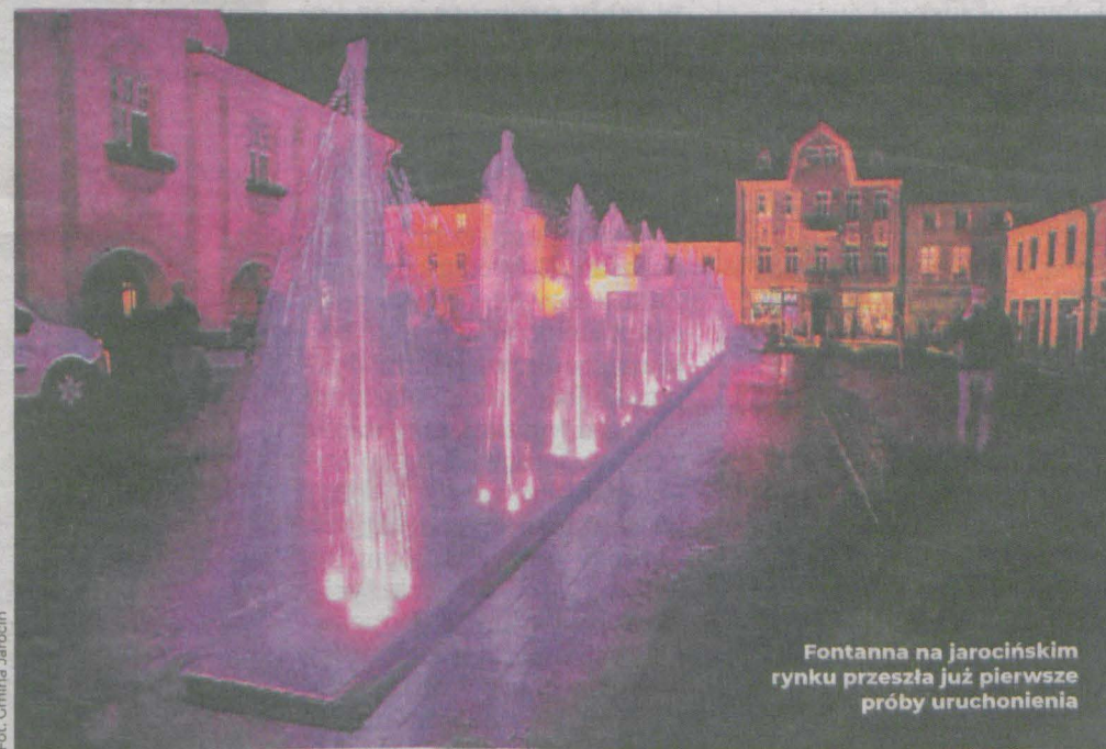
Fontanna na jarocińskim rynku przeszła już pierwsze próby uruchomienia