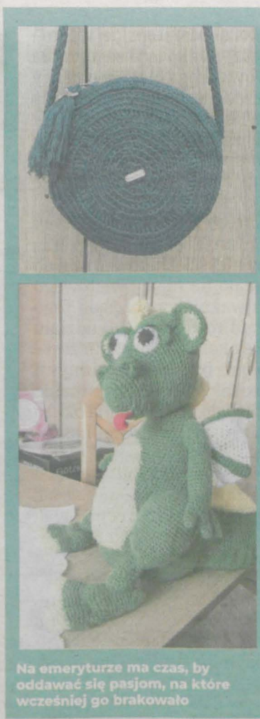
Na emeryturze ma czas, by oddawać się pasjom, na które wcześniej go brakowało

Po ukończeniu szkoły przeszedł moment, by wybrać miejsce zatrudnienia. Czasu na poszukiwanie pracy było w tamtych czasach naprawdę mało. Każdy absolwent miał na jej znalezienie dokładnie 14 dni. Jarocinianka, jak wówczas wszyscy absolwenci, dostała tzw. „nakaz pracy”. - Tak to prawda, ale ja wiedziałam od chwili rozpoczęcia nauki w szkole, że chcę w tym zawodzie pracować. Nigdy nie miałam chwili wątpliwości. Lubiłam pracować z ludźmi i tak było do ostatniego dnia mojej aktywności zawodowej. Mi było łatwiej, bo będąc jeszcze uczennicą miałam praktyki zawodowe na Poczcie Polskiej w Jarocinie. Dookreślałam się w budynku obecnej poczty przy Alei Niepodległości.