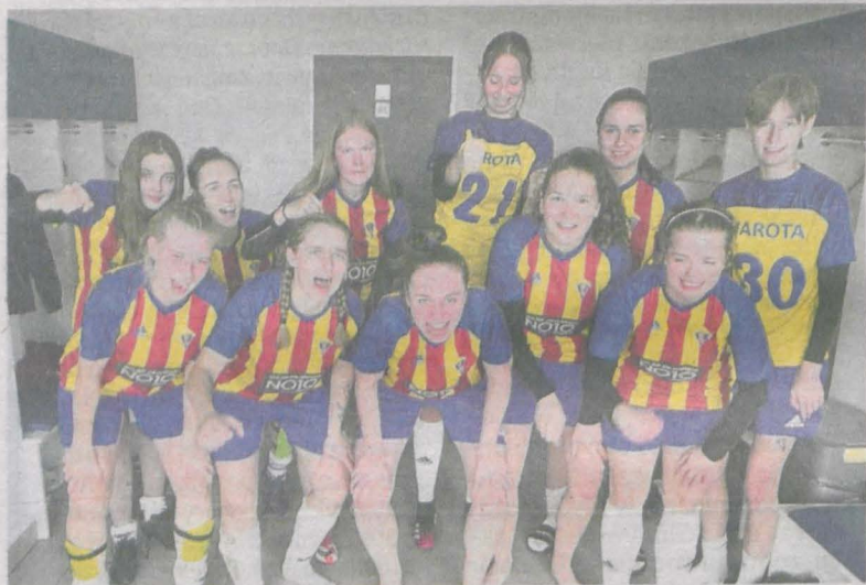
Piłkarki Jaroty Jarocin po trzech meczach w IV lidze kobiet mają na koncie komplet zwycięstw i nie straciły jeszcze gola

PIŁKARKI JAROTY JAROCIN WYGRAŁY 5:0 W GOSTYNIU Z MIEJSCOWĄ KANIĄ w trzeciej kolejce rozgrywek IV ligi kobiet. Debiutujące w rozgrywkach ligowych podopieczne Mirosława Czajki wygrały dotychczas wszystkie mecze!