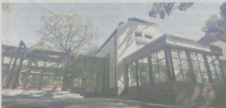
Jeśli wszystko pójdzie zgodnie z planem, wiosną przyszłego roku stylowy kompleks kawiarniano-restauracyjny w jarocińskim parku będzie gotowy